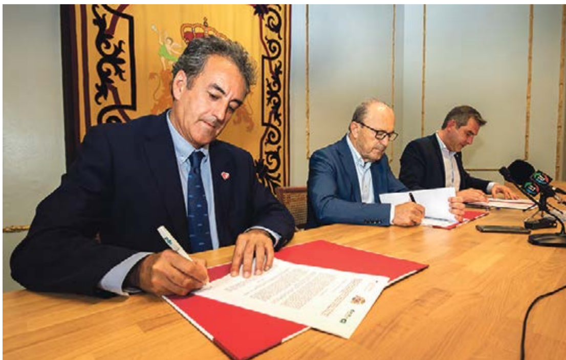
Momento de la firma del convenio que recoge la cesión del espacio de dominio público portuario.

explicado que CANTUR se hará cargo de la gestión de las visitas contratando el personal que se encargará de revisar las reservas en el acceso al faro y de velar por su cumplimiento.