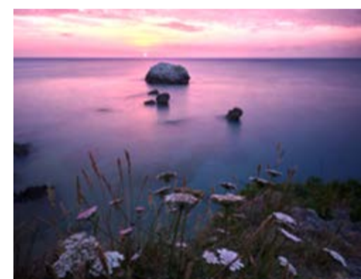
Amanérenos en Pombera.