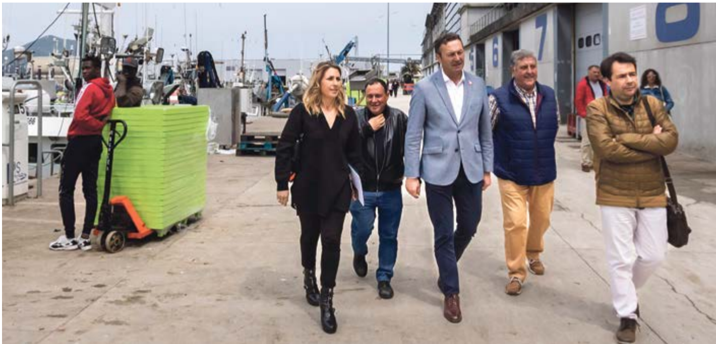
Blanco destaca las buenas cifras de la costera de anchoa y verdel en Santoña que suman descargas de 10 millones de kilogramos.