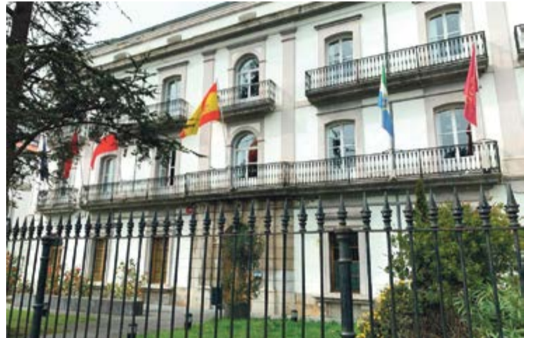
Ayuntamiento de Laredo.