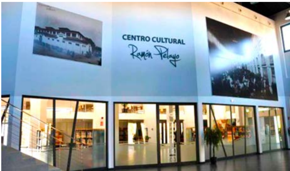
Centro cultural Ramón Pelayo.