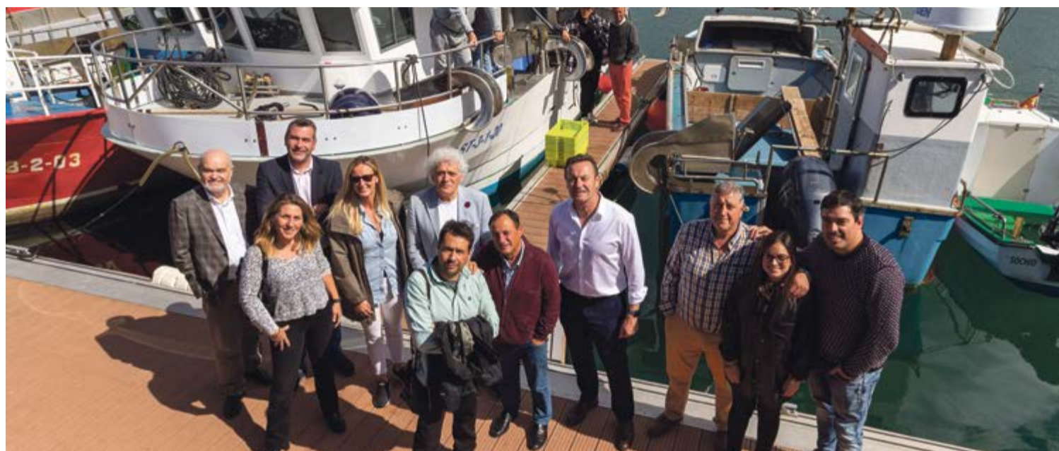
El consejero, junto al resto de autoridades, en el puerto de Santoña.