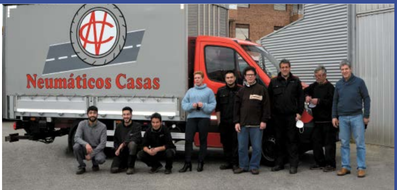
Equipo de profesionales de Neumáticos Casas.

Le recogemos y entregamos su vehículo en su puesto de trabajo.