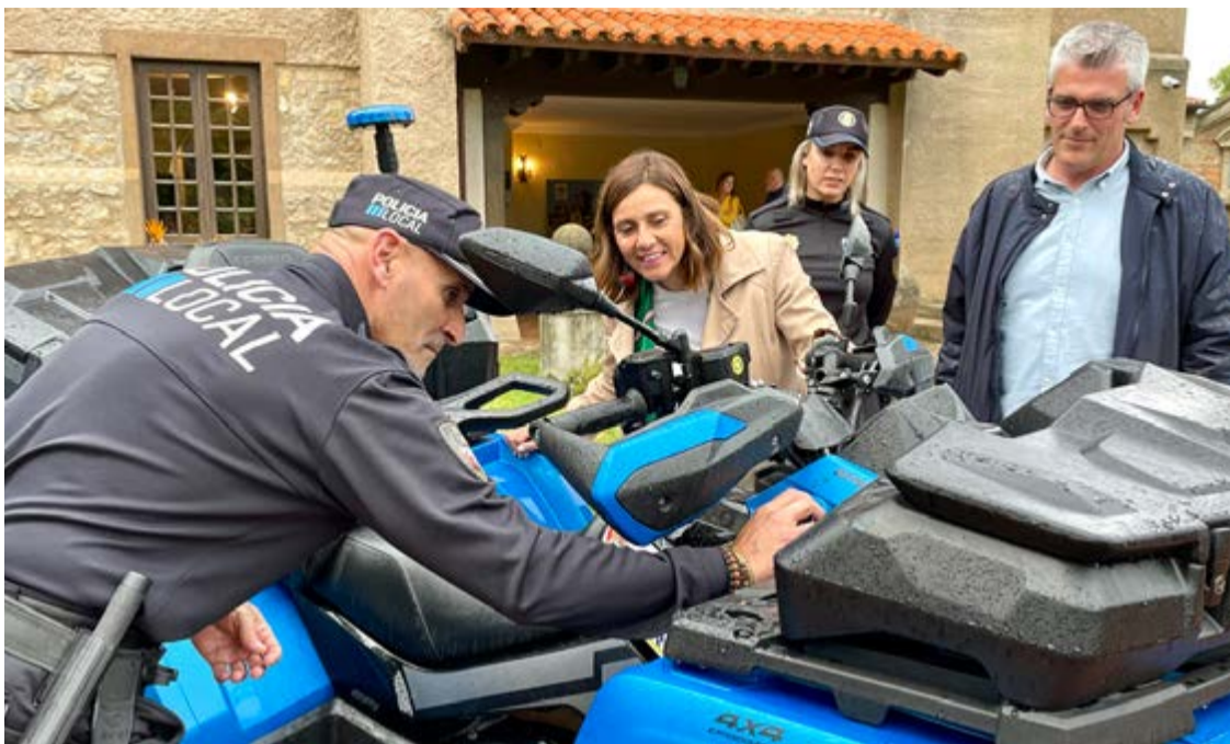
La consejera de Presidencia junto al quad de la policía local.