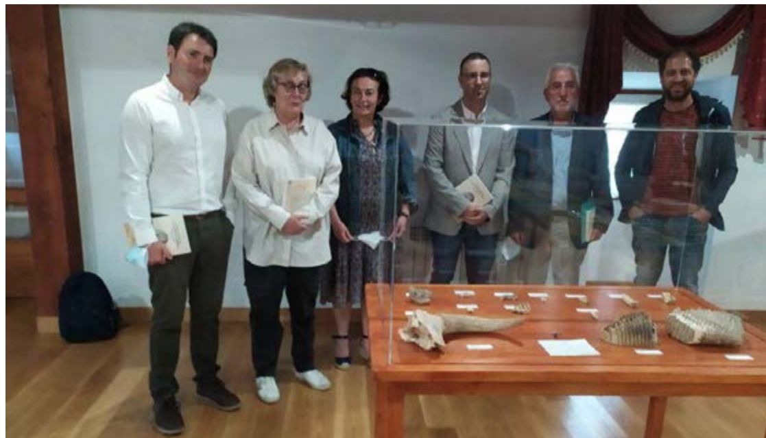
Autoridades presentes en la inauguración.