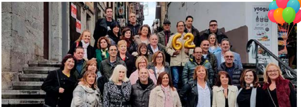
Somos la quinta de esta villa marinera, concretamente del año 62. En este año que cumplimos los 60. ¡Nos reunimos al final con ilusión!