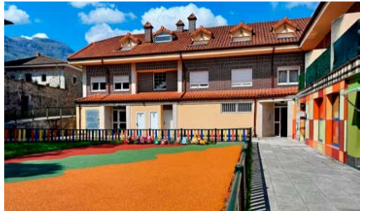
Parque de la guardería.