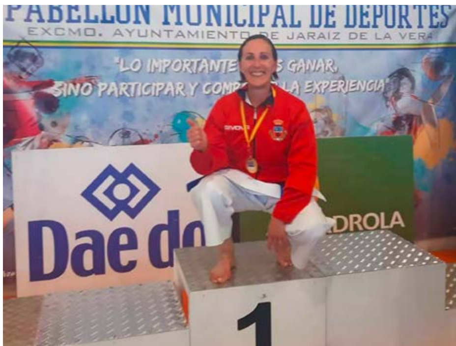
Pili Ateca, Campeona de España de Karate.