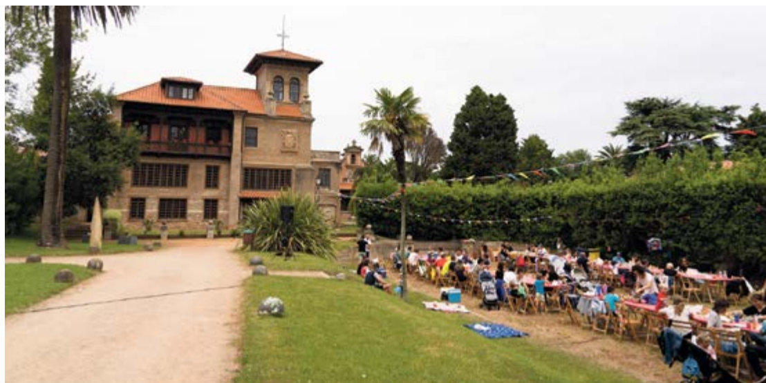
Día de la familia en el Palacio de Albaicín.