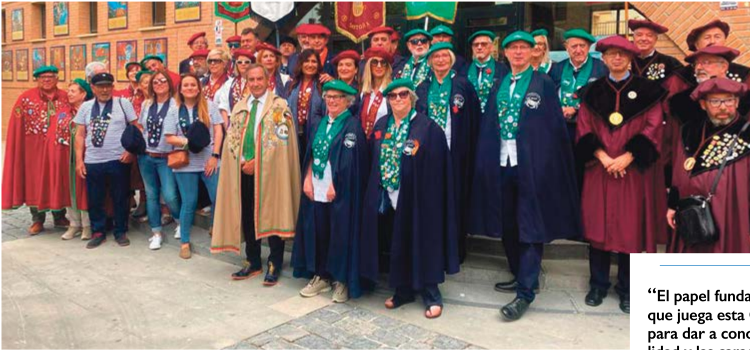
Varios Cofradías estuvieron presentes en el XXX Gran Capítulo celebrado en Mendavia.