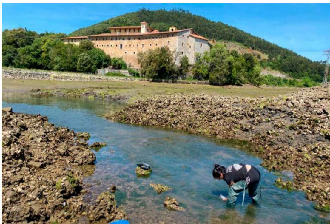
Muestreo realizado en Escalante.