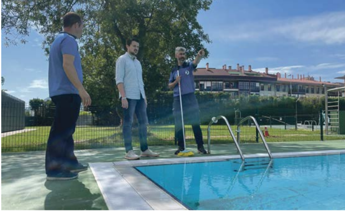
Piscina Municipal de Astillero.

El Ayuntamiento de Astillero abre el plazo para preapuntarse a los cursillos de natación de verano 2022, el cual estará disponible del 1 al 12 de junio. Las piscinas de La Cantábrica acogerán hasta tres ciclos de cursos, que se desarrollarán del 1 de julio al 31 de agosto y que estarán dirigidos a menores a partir de los 5 años.