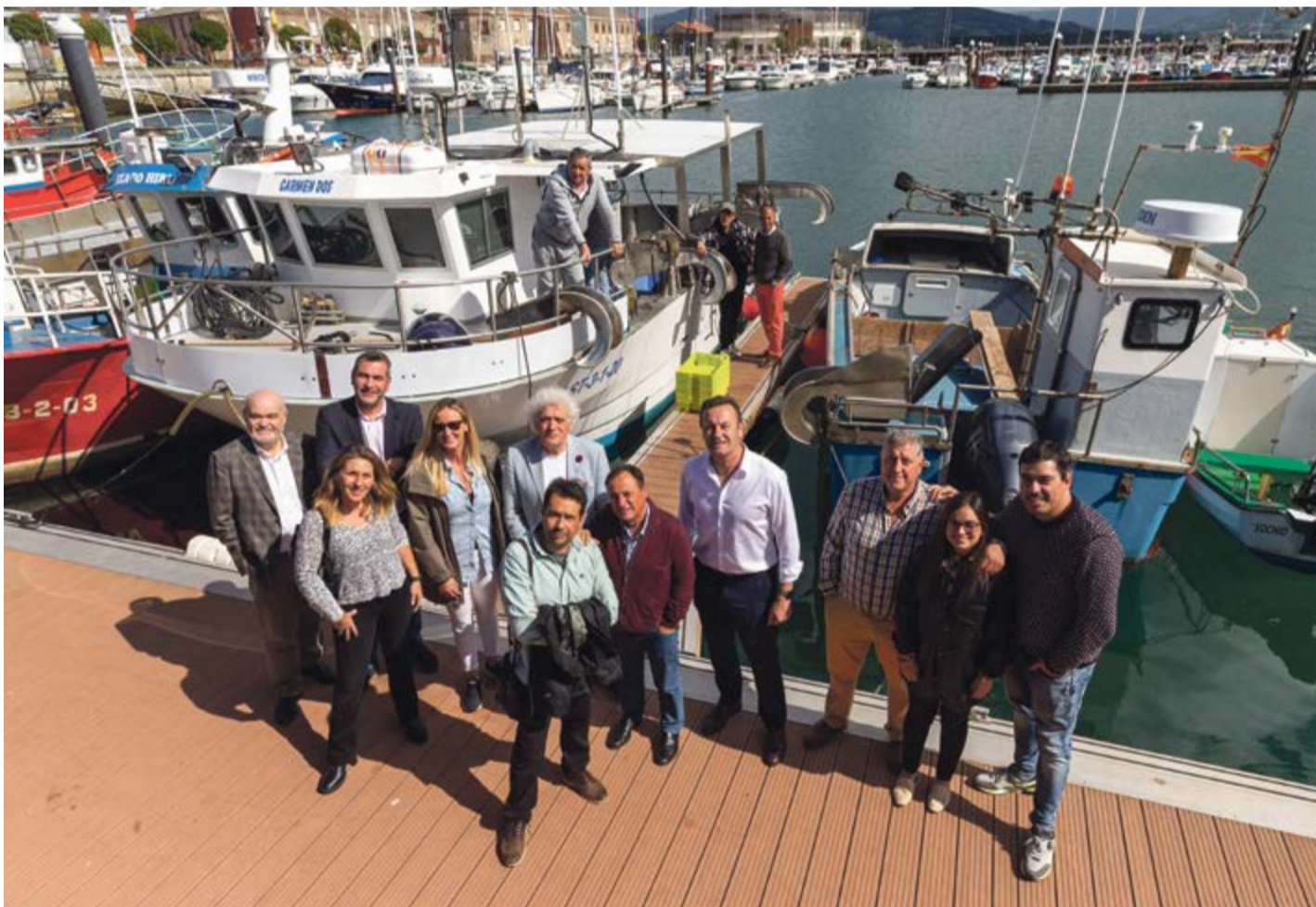
El consejero, junto al resto de autoridades, en el puerto de Santoña.