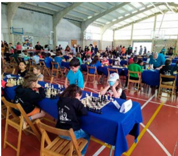
Torneo de Ajedrez Escolar en Ramales.