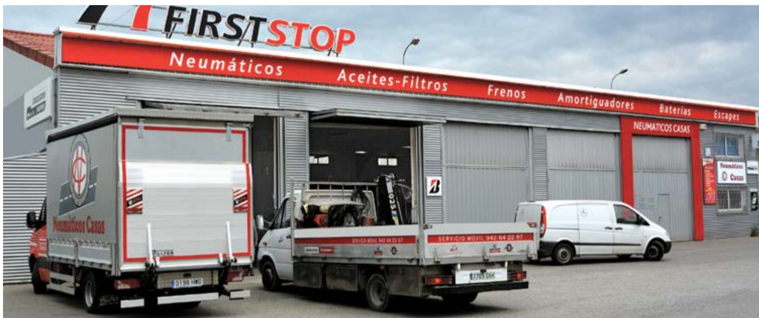
Neumáticos Casas, en Cicero.