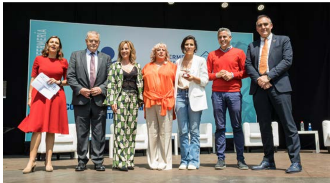
Zuloaga y los consejeros de Sanidad y Presidencia, en el acto conmemorativo, celebrado en Colindres.

situado la atención a la salud en una “encrucijada” para afrontar los grandes retos, marcada por el problema estructural de la falta de profesionales, la consideración de la salud como un bien de consumo que registra un aumento de demanda y los cambios asistenciales adaptados a una población más envejecida.