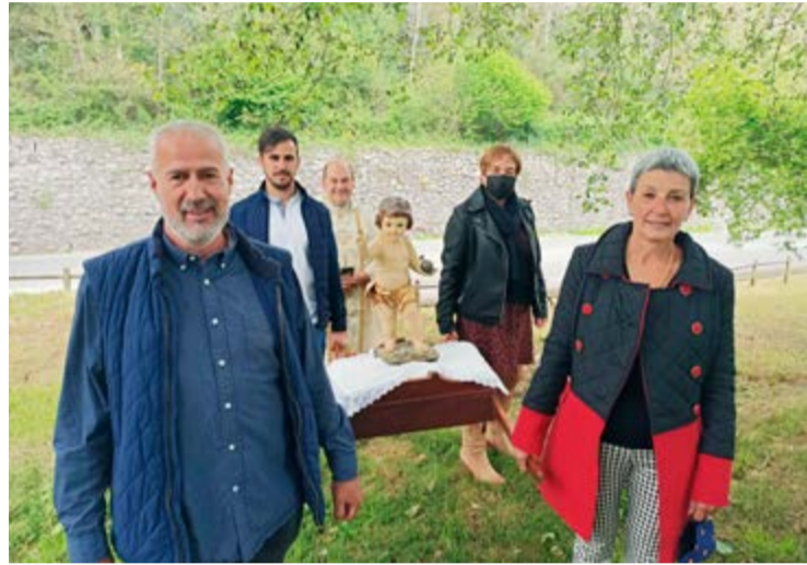
Autoridades locales en la celebración de La Cruz de Mayo en Praves.