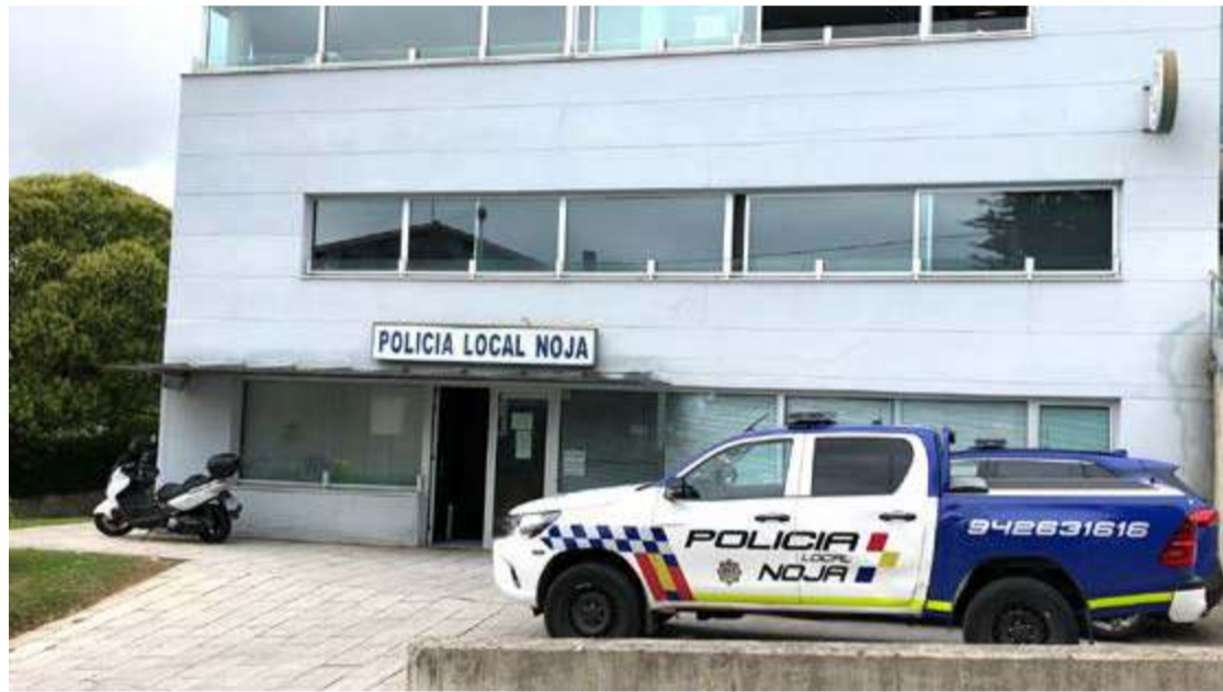
Policía local de Noja.

Hay que recordar que fue el pasado 17 de abril cuando el propio Gobierno de Cantabria anunció que un total de “23 agentes de