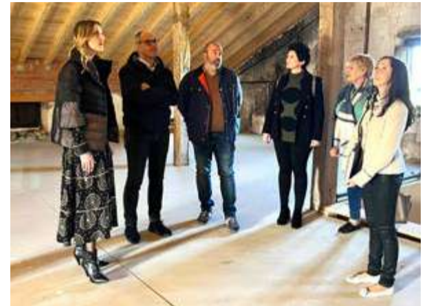
Autoridades comprueban el resultado de las obras.