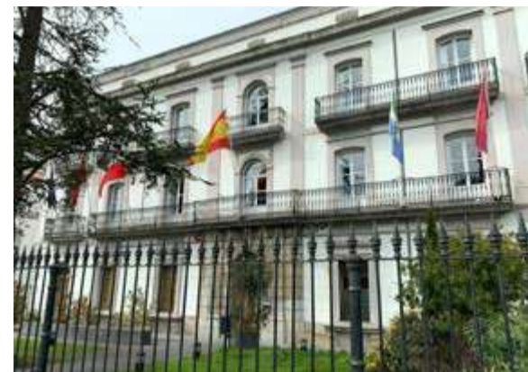
Ayuntamiento de Laredo.

La Agrupación Vecinal Sí Se Puede Laredo, denuncia que después de 34 años las fincas sobre las que se construyó el edificio del Centro de Salud, en la Puebla Vieja, no se han cedido a la Tesorería General de la Seguridad Social. La Agrupación Vecinal, ya desde el anterior mandato, se interesó sobre el tema