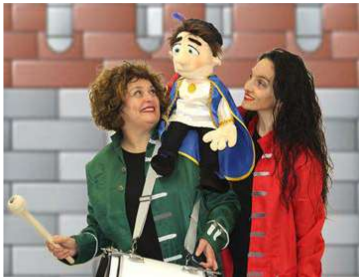
Arte en Escena, grupo de teatro infantil.

A las 18:30 horas en el Teatro Casino Liceo de Santoña, el Mago XUXO ofrecerá el espectáculo de magia teatralizada 'La Magia de las galaxias', inspirado en la mítica saga 'Star Wars'; a las 19:30 horas. Por la tarde, desde las 17:00 horas, el Centro Cultural San Miguel de Aguayo acogerá la actuación de Óscar Alonso con su 'Violín eléctrico' y a las 17:30 horas en Rames