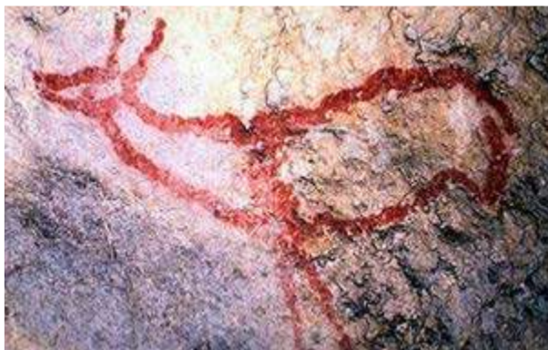
Covalanas, la cueva de arte paleolítico.

Siempre que hay alguna propuesta de creación de casas rurales o de hoteles, somos ágiles concediendo los permisos y las autorizaciones para que se lleven a cabo.