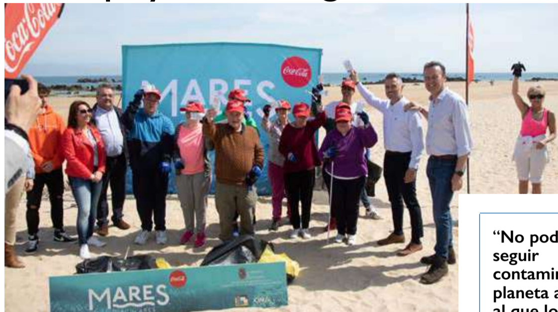
Blanco acompaña a un grupo de personas con discapacidad de la Fundación Obra San Martín.

"Hemos de ser conscientes de que todos tenemos una responsabilidad que debemos asumir para dejar a las futuras generaciones un mundo mejor del que nos encontramos", ha afirmado Blanco, después de felicitar a los