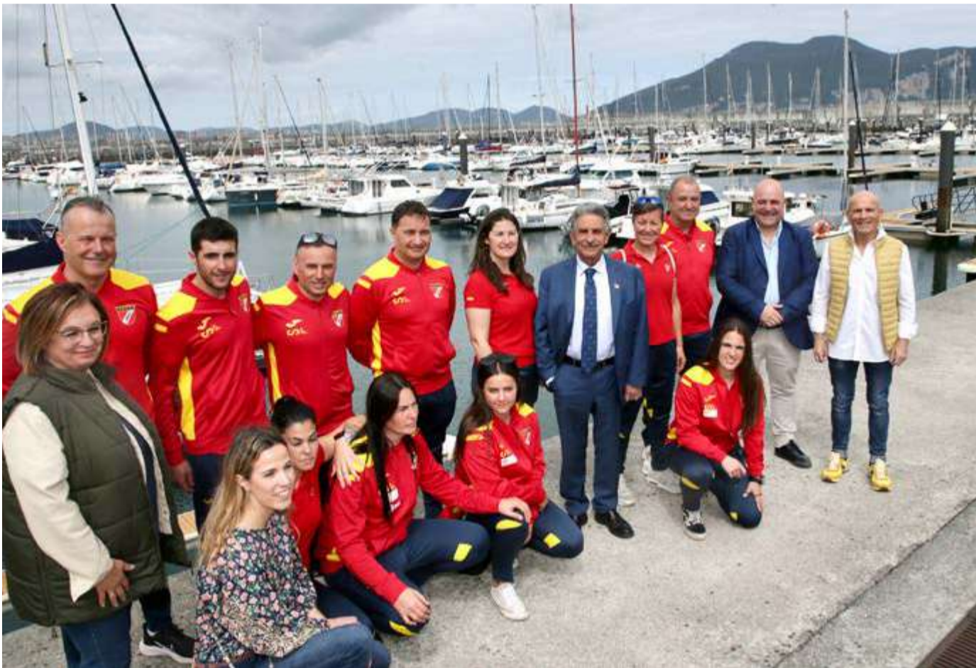
Revilla y autoridades locales junto a los integrantes de la Selección Española de Pesca Submarina.