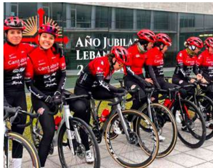
Ciclistas del Club Ciclista Meruelo.

Pero en cualquier caso se trata de un equipo muy compensado, muy unido y con un gran ambiente entre ellas, algo siempre muy importante y que se suele transmitir en la carretera. Las siete ciclistas afrontan, y todo el equipo en general esta semana histórica conscientes de que va a ser muy bonita pero también muy dura. Y acuden a esta cita llenas de positivismo, ganas e ilusión. En eso, como mínimo, van a empatar con el resto de equipos.