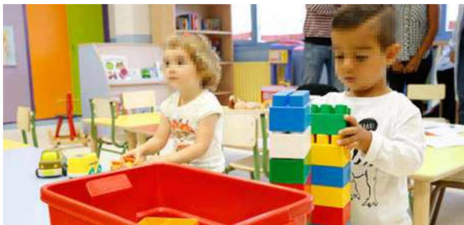
Niños de Infantil participando en las actividades lúdicas.