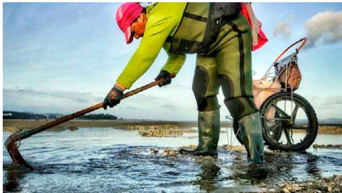
Mariscadora y el marisqueo profesional.

Así, a partir de su entrada en vigor y hasta que se publique