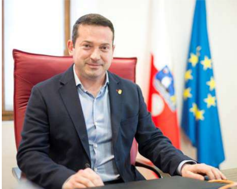
César García, Alcalde de Ramales de la Victoria.

Una buena gestión económica es fundamental, básicamente lo que hemos hecho ha sido gastar el dinero que recaudamos, y al mismo tiempo ir amortizando la deuda, que ha supuesto una buena parte del presupuesto. Ahora ya se ha reducido bastante, pero algunos años hemos llegado a pagar 150.000 € de deuda, y eso lo tienes que recortar de inversiones, compras, etc., lo cual ya te limita un poco, pero en general, la clave es ser eficaces con la gestión de recursos de la que se dispone. Nosotros ejecutamos el presupuesto y procuramos no gastar más del dinero del que disponemos.