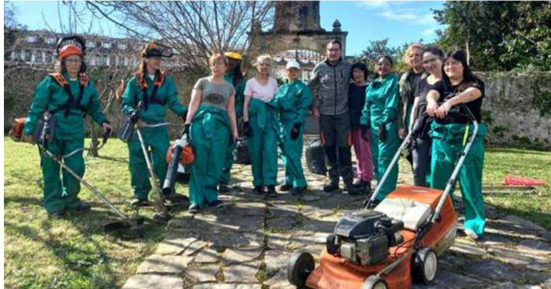
Participantes del programa de Apoyo a Mujeres en el Ámbito Rural y Urbano de Noja.

En este sentido, desde el Ayuntamiento se ha detallado que todavía quedan plazas disponibles para poder inscribirse en el