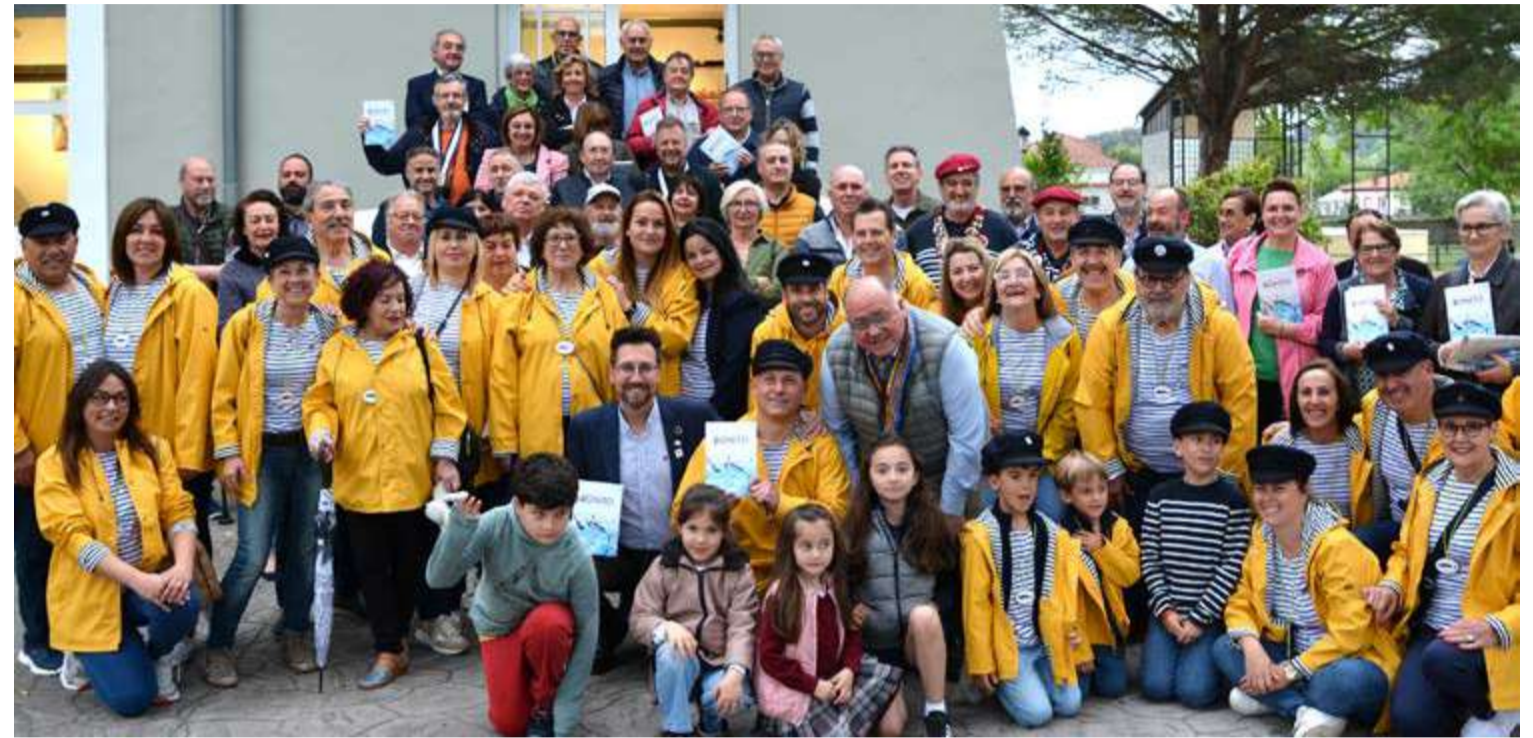
Miembros de la Cofradía del Bonito del Norte de Colindres junto a autoridades locales e invitados.

El libro que además de estar en edición impresa, también se puede descargar de forma gratuita en versión digital a través de las diferentes redes sociales de la Cofradía del Bonito del Norte de Colindres, cuenta con numerosas recetas de cocina, modernas y tradicionales, cuyo ingrediente principal es siempre el Bonito del Norte, nos habla de las artes de la pesca de estos ejemplares y nos hace un recorrido con un poco