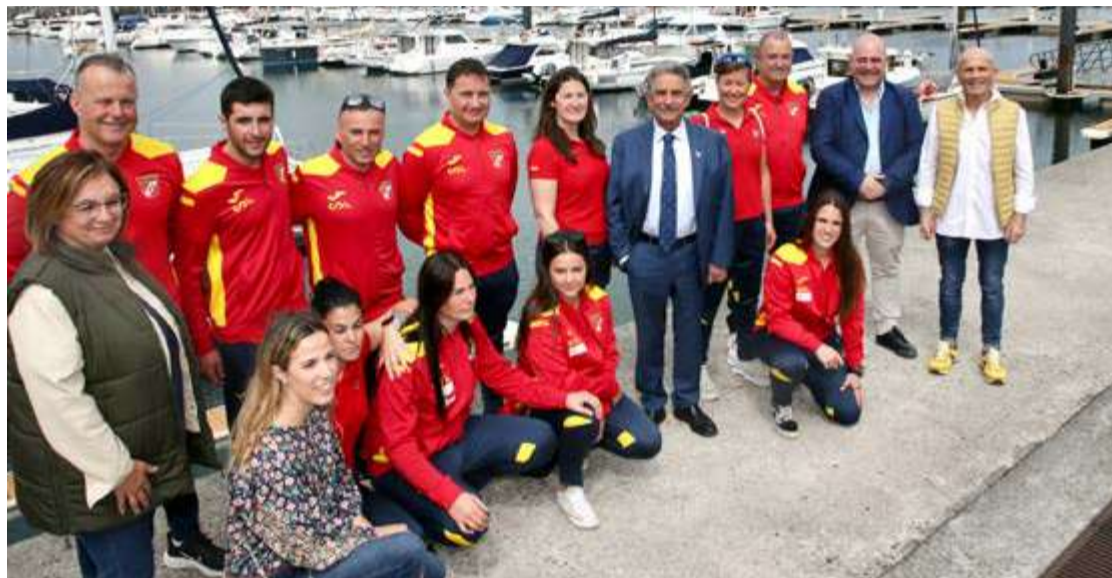
Revilla y autoridades locales junto a los integrantes de la Selección Española de Pesca Submarina.

El presidente ha puesto en valor el potencial de España en este deporte y ha destacado la importancia del acontecimiento para "poner en el mapa" a Cantabria, a Laredo y a su