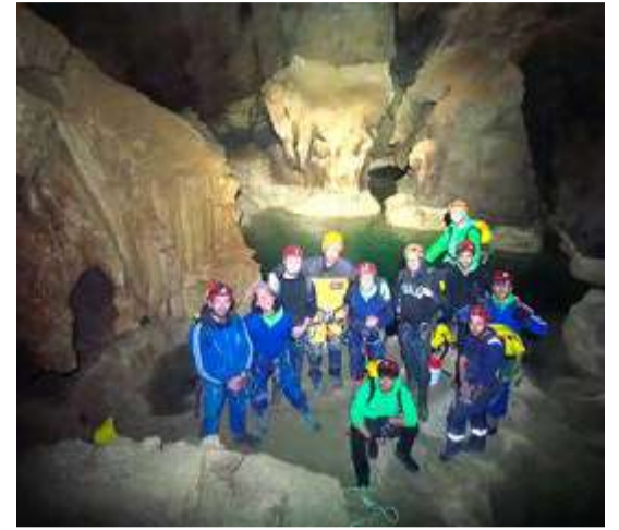
Actividades Escuela de Talento Joven.