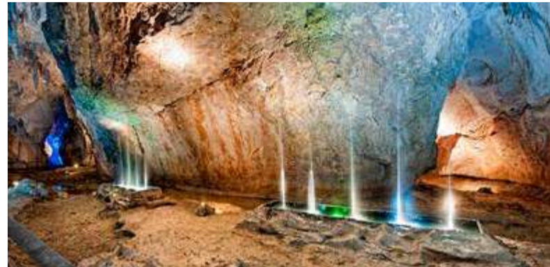
Cullalvera, alberga el conjunto más profundo del arte rupestre cantábrico.