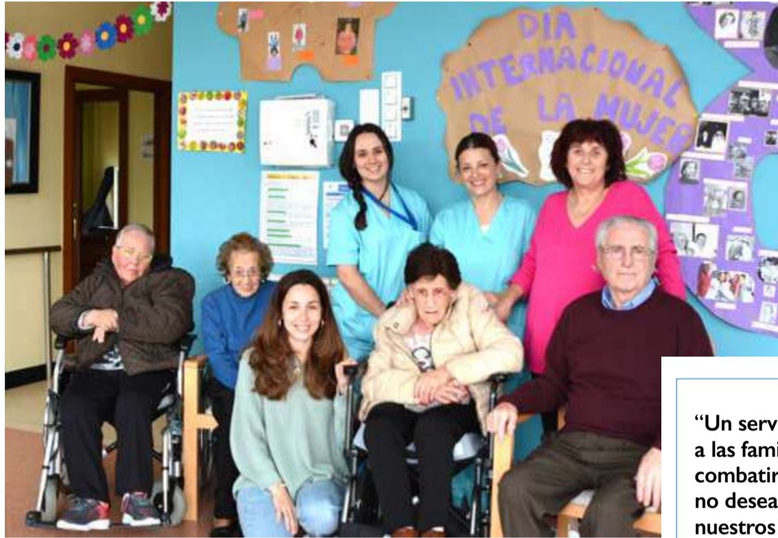
Usuarios y trabajadores del Centro de Día de Colindres.

Para acceder a los servicios del Centro de Día de Colindres de forma concertada es requisito imprescindible tener reconocido el grado de dependencia. Las plazas concertadas se adjudican dependiendo del grado 1, 2 o 3, y