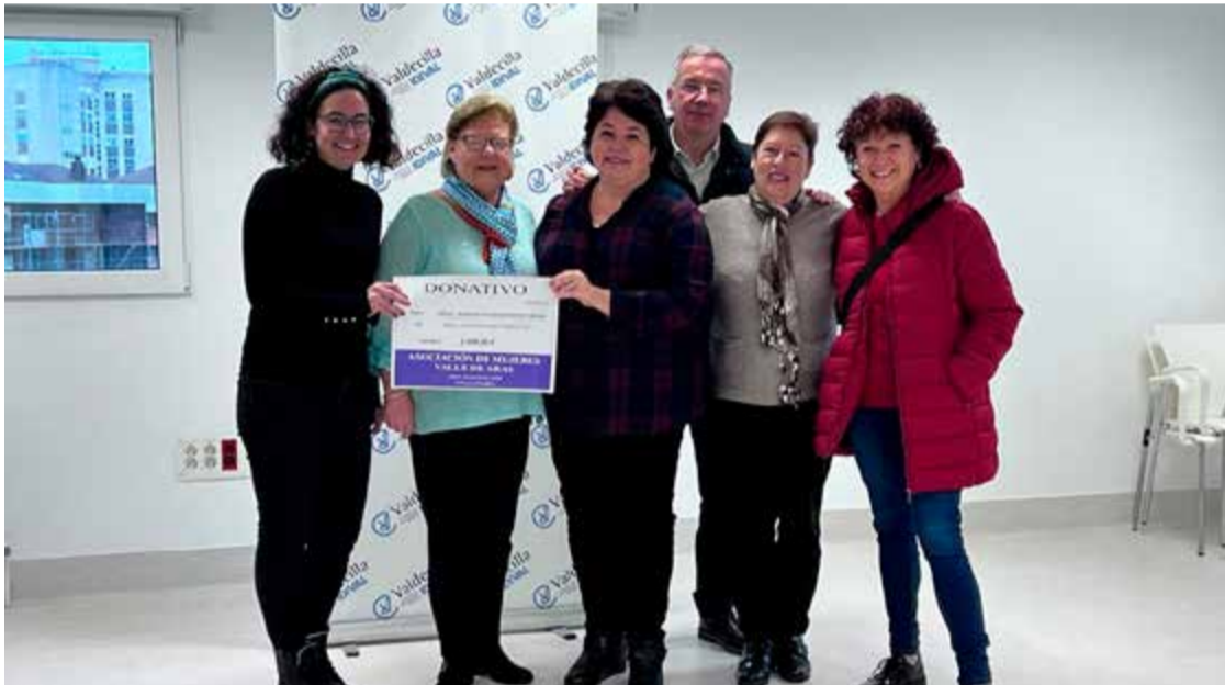
Momento de la entrega del donativo a IDIVAL.

AMVA, la Asociación de Mujeres del Valle de Aras en Voto, está integrado por un grupo de mujeres que dedican su tiempo libre a realizar trabajos manuales de costura, ganchillo, pintura, etc. Posteriormente venden sus productos en mercadillos y ferias artesanales para recaudar fondos, y el dinero recaudado lo destinan a donaciones para diferentes asociaciones sin ánimo de lucro. El pasado mes de diciembre hicieron una donación de 1.000 € al Instituto de Investigación de Valdecilla, IDIVAL. Siempre es de agradecer que haya personas solidarias y comprometidas con causas sociales como estas mujeres del Valle de Aras. ¡Felicidades!