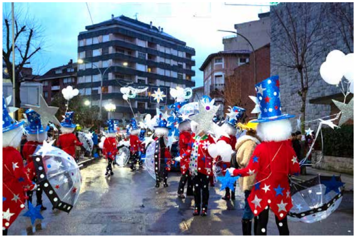
Carnavales de Laredo.