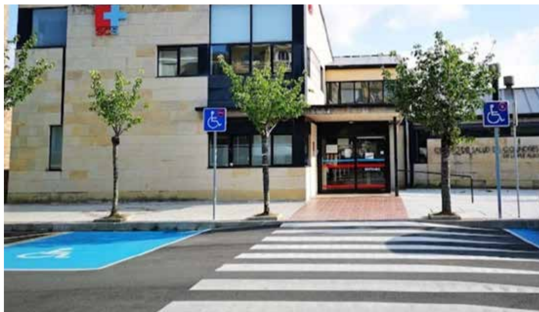
Centro de Atención Primaria de Colindres.