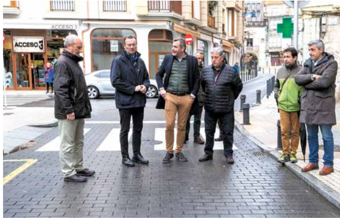
Blanco comprueba la actuación acometida por MARE con una inversión de más de 68.000 euros.

La ejecución de los trabajos con zanjas en red general ha supuesto la reposición y mantenimiento de servicios afectados,