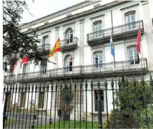
Ayuntamiento de Laredo.

Este equipo de gobierno, con esta alcaldesa al frente,