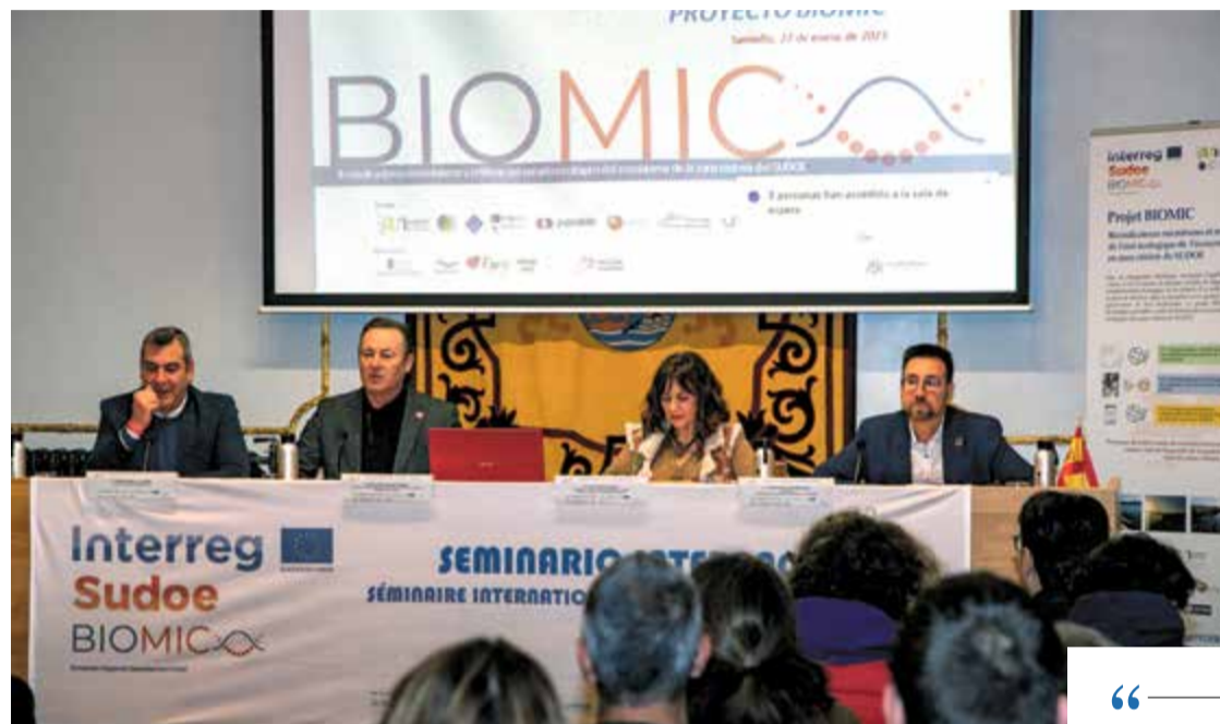
Los consejeros de Economía y Desarrollo Rural asisten a la apertura del seminario.

Los consejeros han coincidido en reafirmar el compromiso de apoyo del Gobierno de Cantabria con un proyecto que contribuye a fomentar la protección de las zonas costeras y la preservación