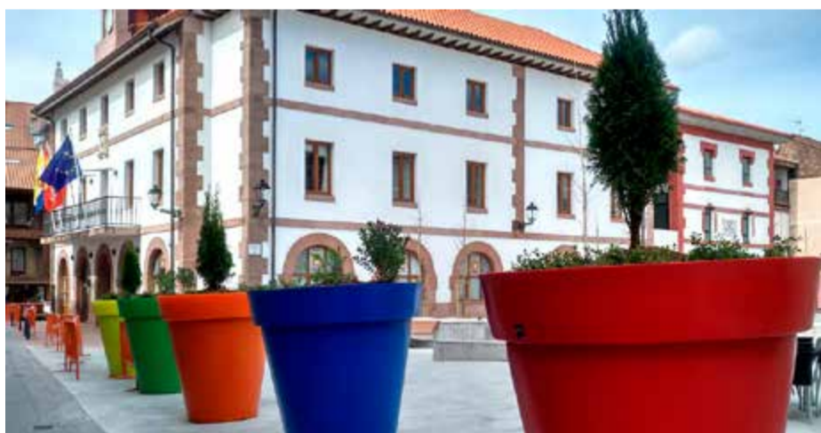
Plaza del Ayuntamiento.