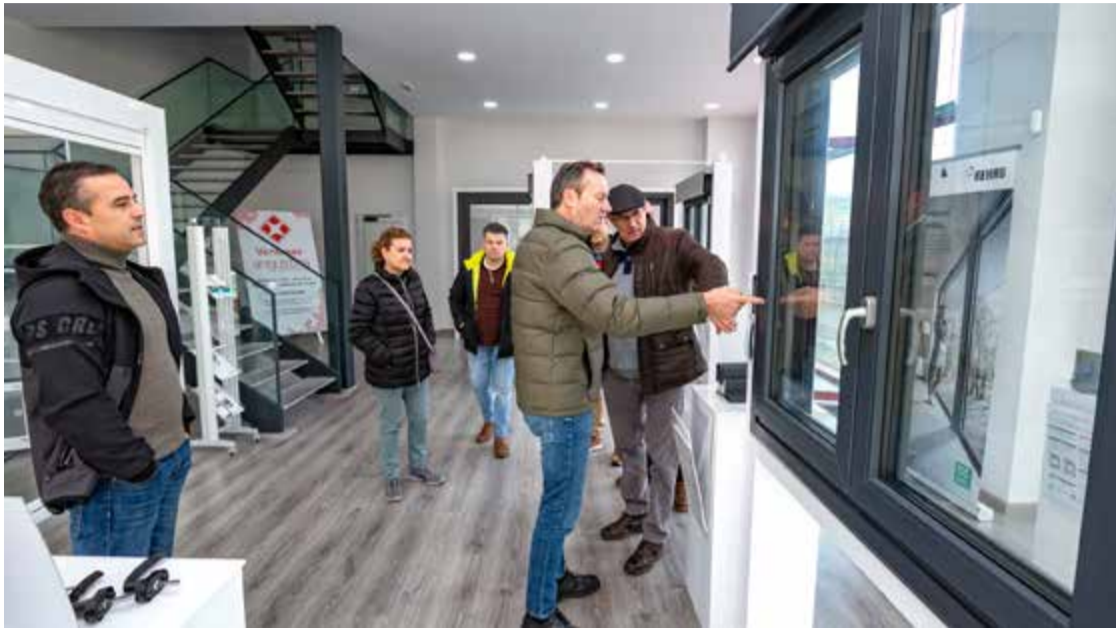
El consejero visita las nuevas instalaciones de Carpintería Metálica Angustina en Ramales de la Victoria.