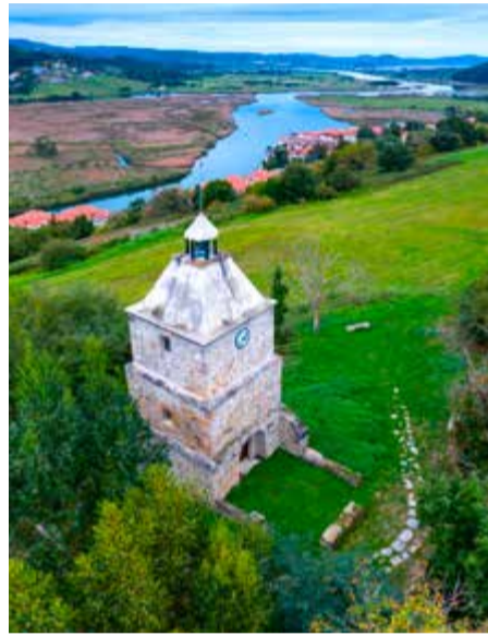
Torre del Reloj.

“ En los últimos tiempos, percibo más implicación de los municipios vecinos, e incluso a otros organismos supramunicipales, nos vamos uniendo en la demanda de la solución definitiva ”