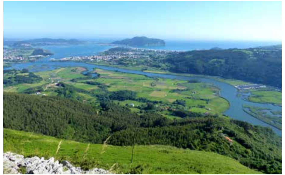
Panorámica de las Marismas de Limpias y Santoña.