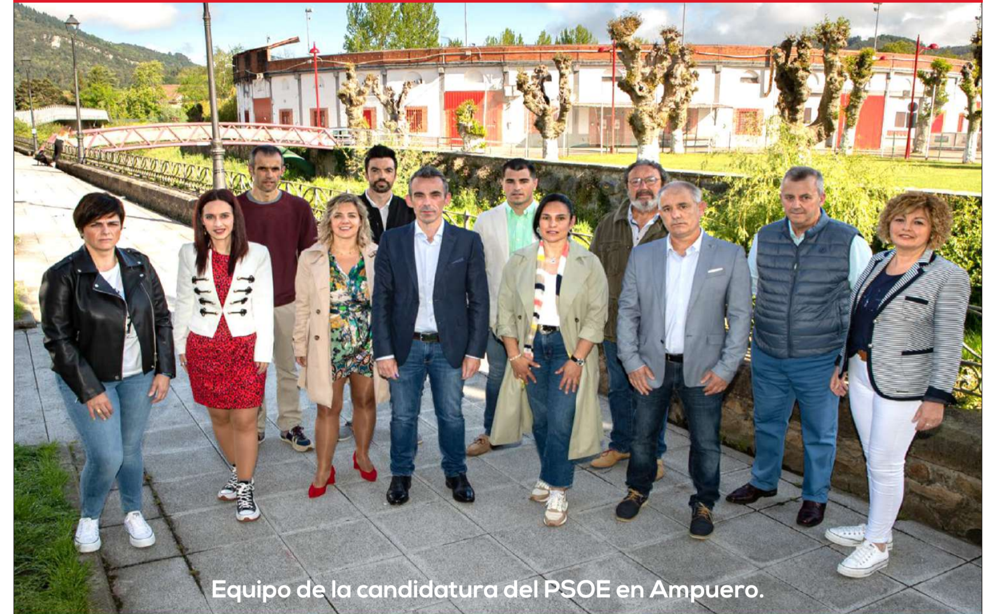
Equipo de la candidatura del PSOE en Ampuero.