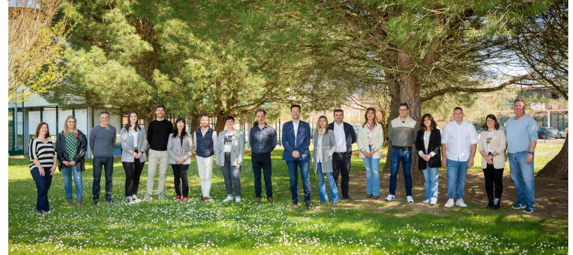
“Juntos fortaleceremos los pilares fundamentales del estado de bienestar”. Equipo de la candidatura del PSOE Colindres.