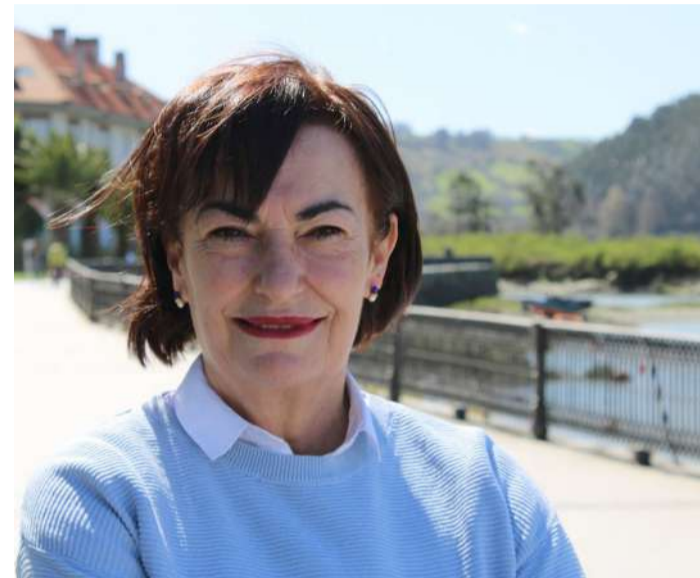
Mar Iglesias Candidata a la Alcaldía de Limpias

Mar Iglesias, alcaldesa de Limpias en la actualidad, se presenta a la que será su quinta legislatura si vuelve a ser elegida, y lo hace más motivada que nunca, porque ha visto los cambios tan positivos que ha experimentado Limpias desde que llegó a la alcaldía, y asegura que no le gustaría dejar el cargo sin haber terminado antes todos los proyectos con los que se ha comprometido y aún quedan por terminar.