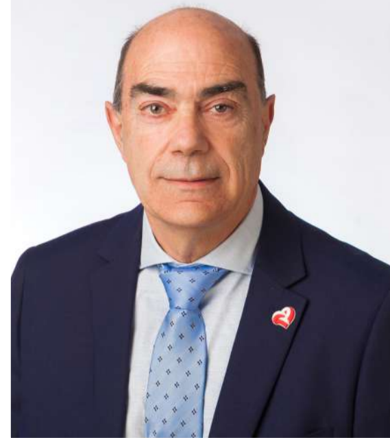
Equipo de la candidatura del PRC Limpias/Seña.