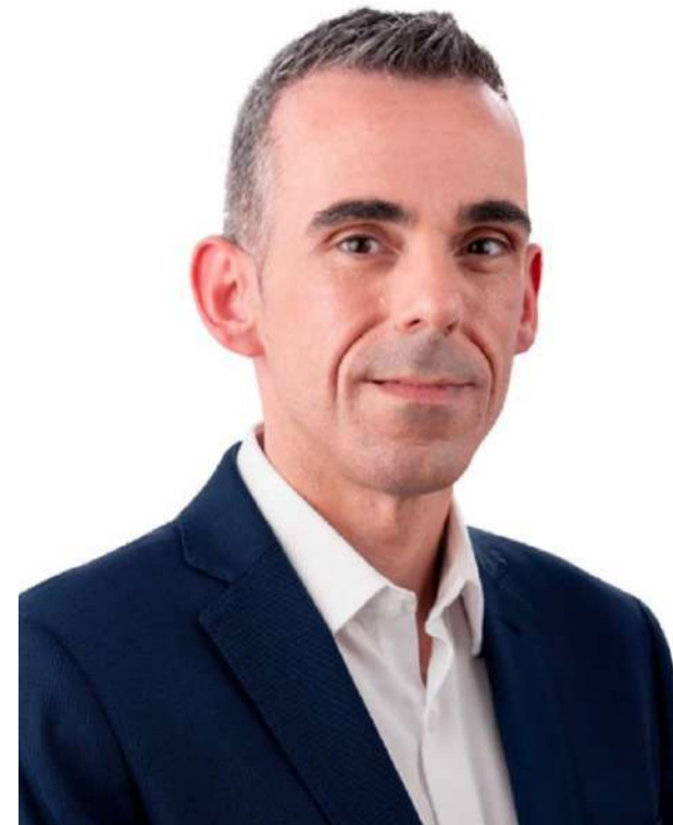
Víctor Gutiérrez Candidato a la Alcaldía de Ampuero