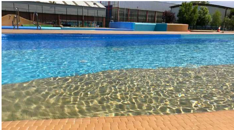
Piscinas al aire libre de Colindres.