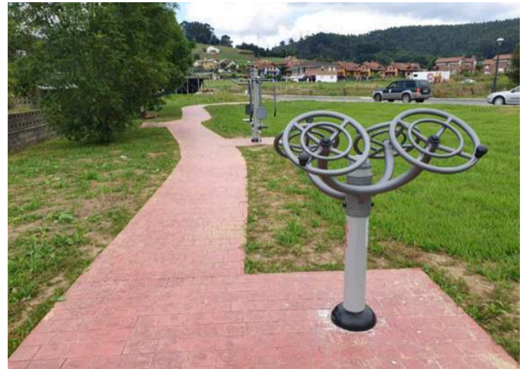
Paseo biosaludable en Cicero.

El pueblo de Cicero estrena un paseo biosaludable, ubicado en un entorno natural, agradable y soleado, lo que convierte el ejercicio en una experiencia relajante.