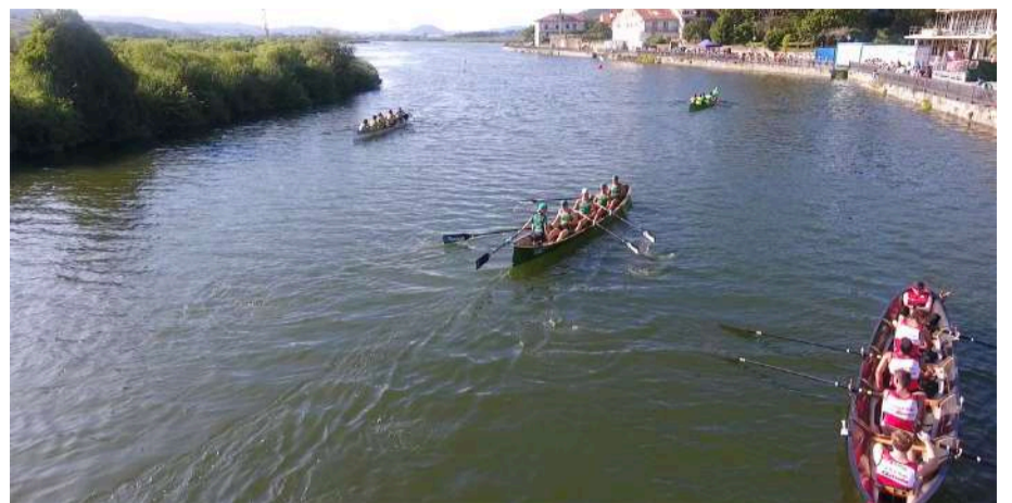
Regata de Bateles en Limpias. Foto de archivo.