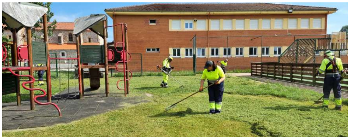
Nuevos trabajadores contratados dentro del Programa de Corporaciones Locales .