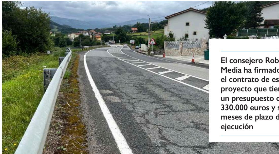
Tramo de la CA-268 donde se ejecutará la actuación.