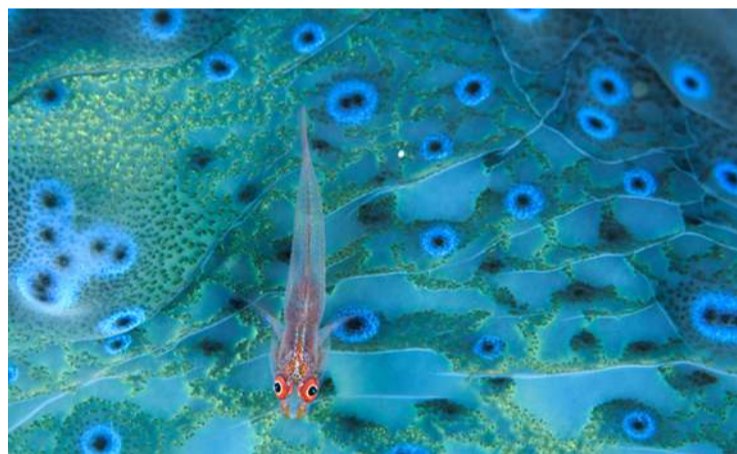
Un góbido descansa sobre una almeja gigante en el fondo marino.

En un lugar diverso como el planeta Tierra, los colores no tienen el mismo significado en