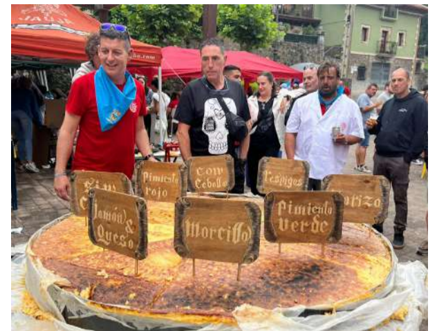
Tortilla gigante preparada por la Peña Los Retales.