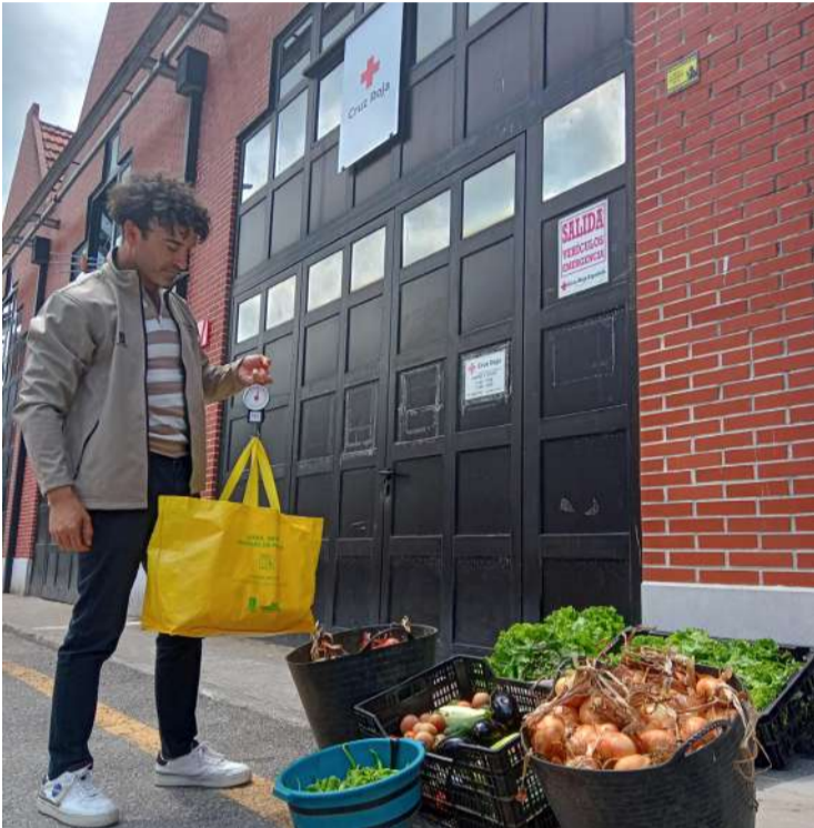
Productos entregados al banco de alimentos de Cruz Roja en Santoña.

Durante 2023 se han entregado al banco de alimentos de Cruz Roja en Santoña más de 700 Kilos de productos hortofrutícolas agroecológicos procedentes de la Escuela de Formación y Emprendimiento Agroecológico de la Mancomunidad. En las diversas entregas realizadas