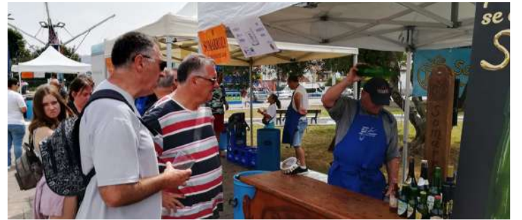
Feria de la Sidra en Argoños.