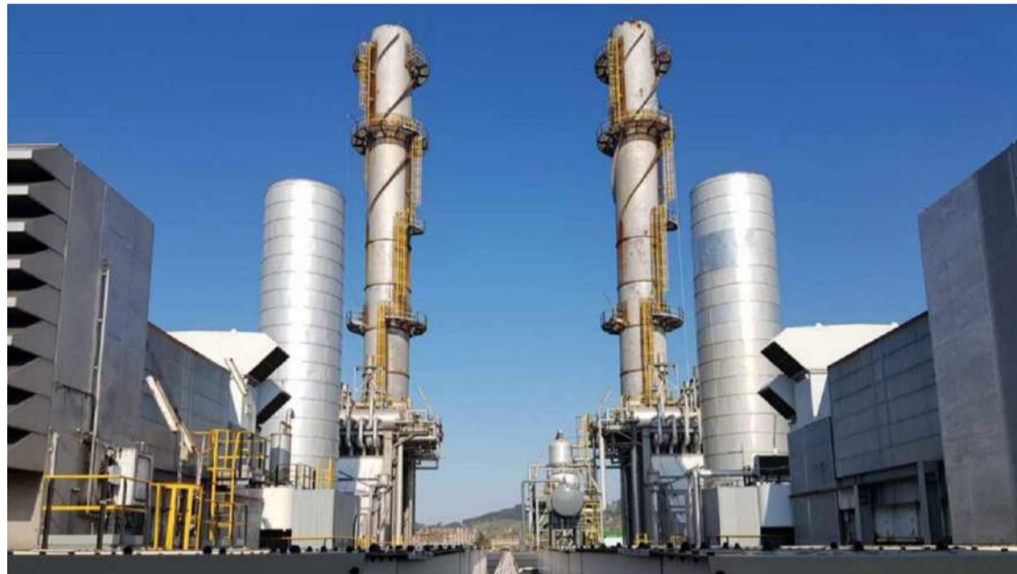
Factoría de Sniace.

Copsesa es una empresa familiar cántabra, con más de 30 años de trayectoria, fundada en 1977