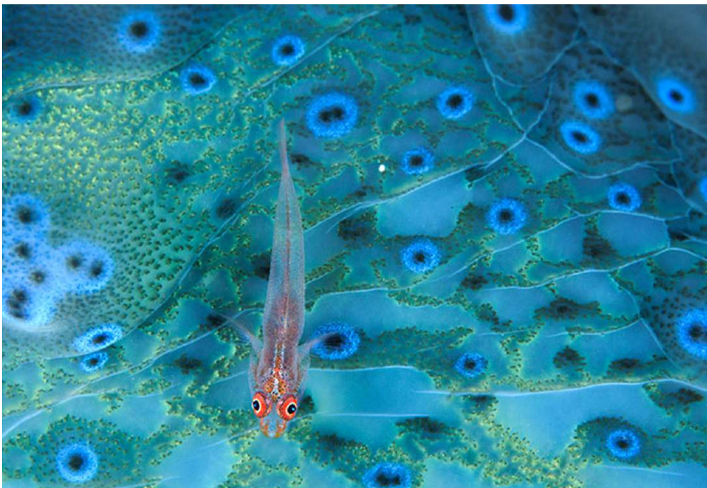
Un góbido descansa sobre una almeja gigante en el fondo marino. Exposición “Colores del mundo”