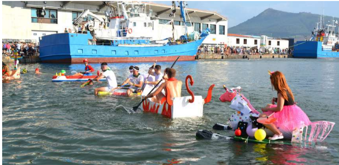
Artefactos navegables en las aguas del Puerto de Colindres.

Aunque se celebra cada año, conviene recordar las principales bases del concurso, como por ejemplo que no se puede utilizar ningún tipo de embarcación como base del artefacto, tampoco pueden utilizar motores para su desplazamiento, deberán permanecer a flote al menos 20 segundos, y se puntuará positivamente el mayor número de ocupantes del artefacto, así como el vestuario utilizado.