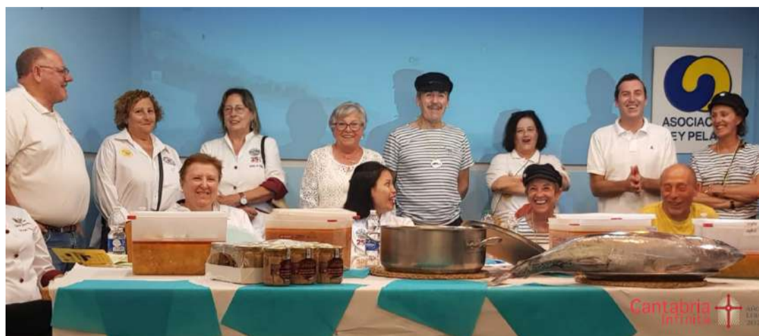
Representantes de la Cofradía del Bonito del Norte de Colindres, colaboran con la Asociación avilesina Rey Pelayo.