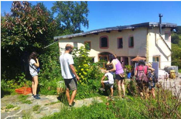
ECO-experiencia en Abrazohouse.