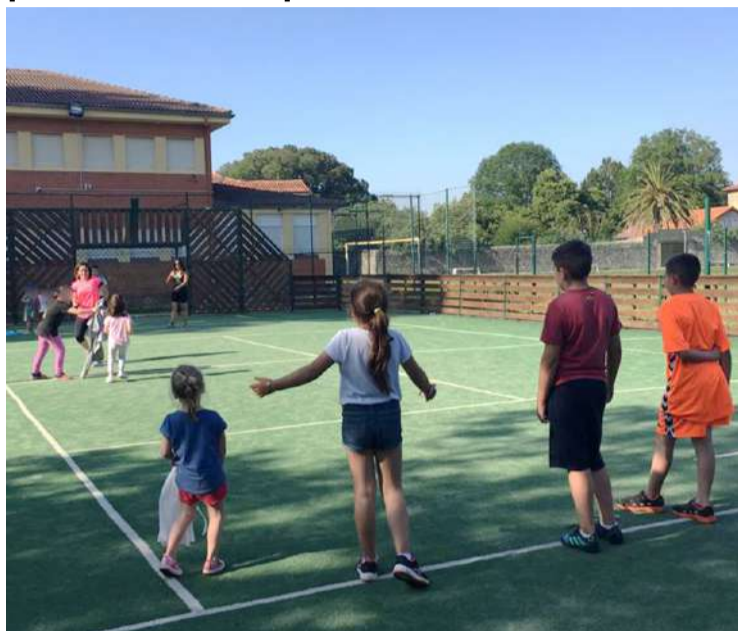
Foto de archivo Campamento de Verano Hazas de Cesto.