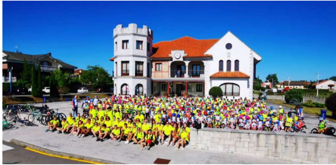
Las actividades deportivas y de ocio cuentan con más de 300 niños este año.