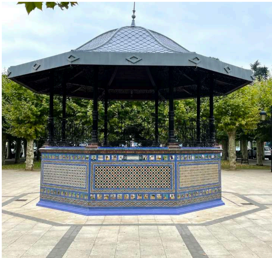
Kiosko de Colindres, junto a la Alameda del Ayuntamiento.