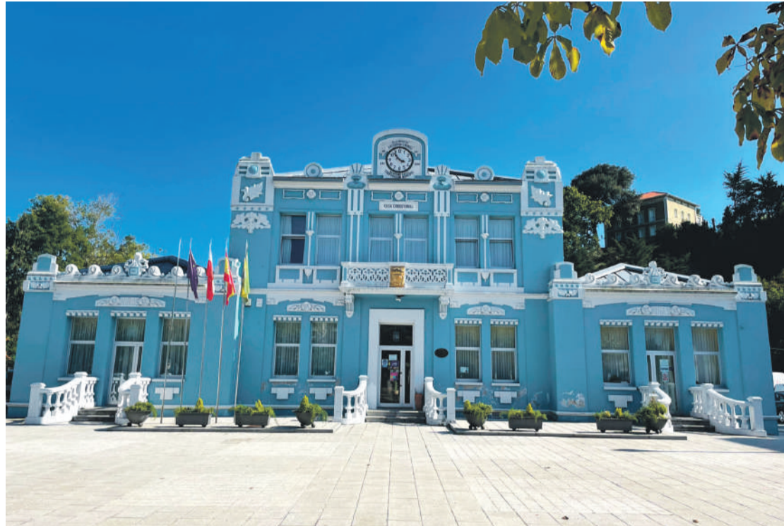
Ayuntamiento de Colindres.

Las actividades continúan, el 27 de julio a las 22:30 h en los jardines de la Casa de Cultura, cine de verano con la película “Tadeo Jones 3”. El viernes 28 a las 20:30