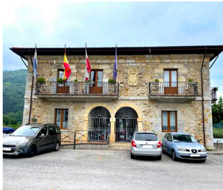
Ayuntamiento de Limpías.

las prioridades que dieron forma al programa electoral del grupo popular. Proyectos entre los que destacan la dotación de unas instalaciones dignas para el CRA Asón con la renovación y mejora de las instalaciones exteriores; la construcción de instalaciones deportivas entre las que destaca el Polideportivo o unas pistas de pádel; la búsqueda y aplicación de soluciones provisionales para el tema de los vertidos, así como una estrategia de presión institucional que ayude a acelerar dichas medidas; u otras medidas que afectan más al día a día de los vecinos como la supresión de las barreras arquitectónicas o la planificación de medidas de alivio fiscal para los vecinos, mediante