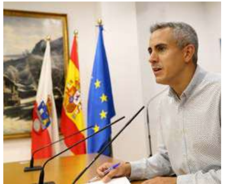
Pablo Zuloaga, durante la rueda de prensa de Consejo de Gobierno.