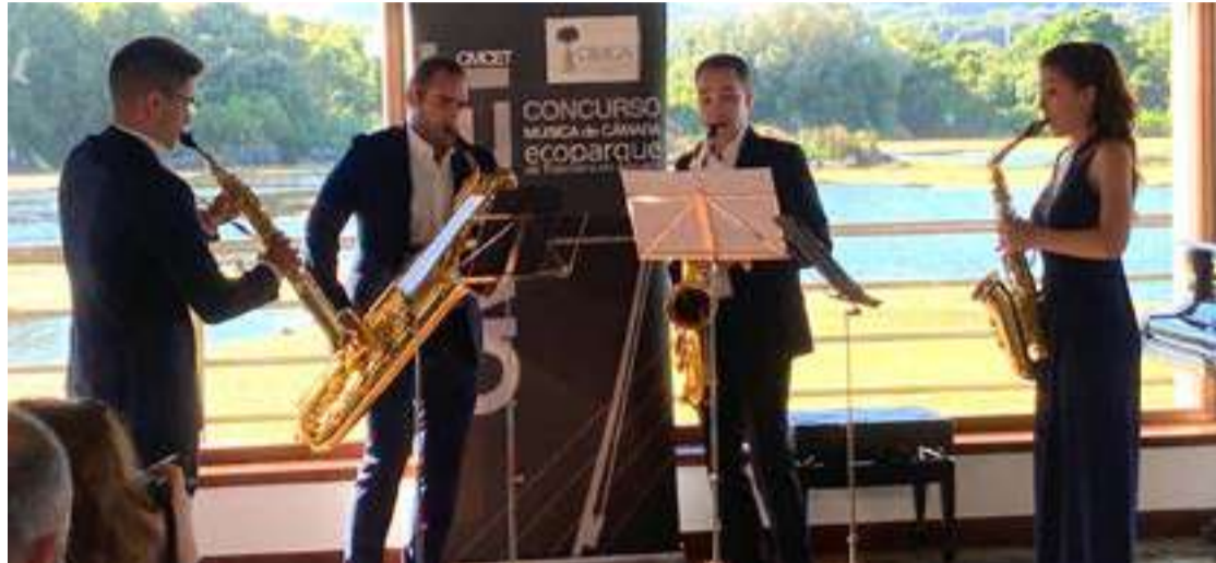
Momento de la actuación de Litore.

El sábado día 1 tendrán lugar las audiciones clasificatorias en la Casa de las Mareas de Soano, para las que hay inscritas diez agrupaciones, de las cuales tres son extranjeras. Este año cabe destacar la participación de una agrupación de dos pianos. Por último, el domingo 2 de julio a las 18.00 h, la Casa de las Mareas acogerá la gran final, con las cuatro agrupaciones que el Jurado determine como finalistas, y tendrá lugar el acto de entrega de premios. El Concurso está