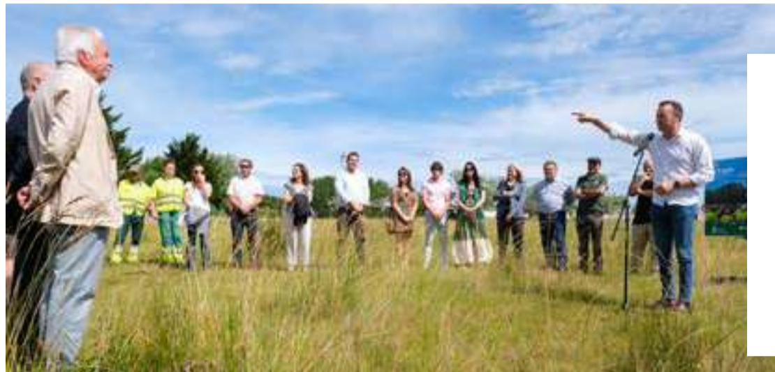
El acto conmemorativo se ha celebrado en la Marisma Victoria de Noja.

Promovido por el Gobierno de Cantabria y cofinanciado por fondos LIFE de la Comisión Europea y por el Gobierno regional a través de la Consejería de Medio Ambiente, el proyecto Stop Cortaderia ha sido posible gracias, en gran medida, a la participación activa de 22 personas con discapacidad a lo largo de toda