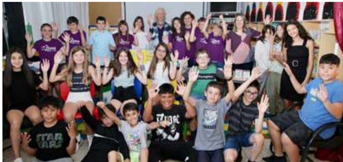
Alumnado participante, equipo educativo y autoridades.

El equipo de 6º A de Primaria del CEIP Miguel Hernández de Castro Urdiales se alzó con el primer premio de este evento en la categoría de Primaria, celebrado el pasado mes de abril. Un proyecto que da a conocer qué son las nanopartículas, las aplicaciones prácticas de la nanotecnología, así como el diseño de nanorrobots para abordar problemas medioambientales