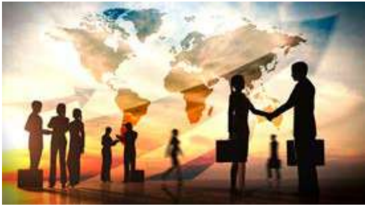
El objetivo es crear sinergias empresariales y dar visibilidad a los productos y servicios generados en Cantabria.