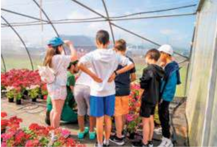
Escolares del municipio celebran el Día Mundial del Medio Ambiente.

El pasado 5 de junio Colindres celebró el Día Mundial del Medio Ambiente, con una semana cargada de actividades y visitas dirigidas a los escolares del municipio.