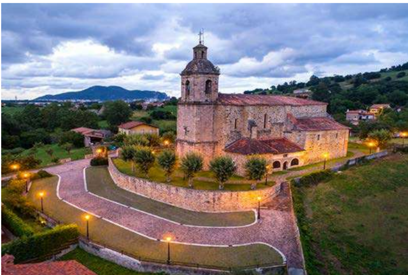
Vive un verano intenso y diferente con actividades de arte, ocio, cultura y naturaleza en Cantabria Oriental. Iglesia de San Juan, situada en Colindres de Arriba.