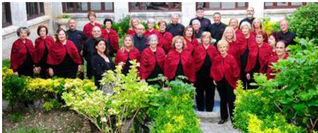
Foto de familia de La Coral Canta Laredo.

El día 17 de julio darán comienzo las Jornadas Internacionales de