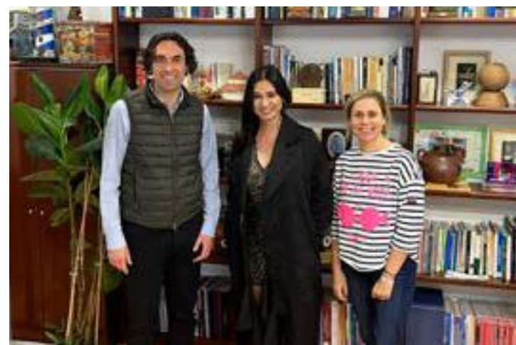
La vecina de Astillero visita al alcalde del municipio tras presentar su nueva colección en la Fashion Week de Madrid.