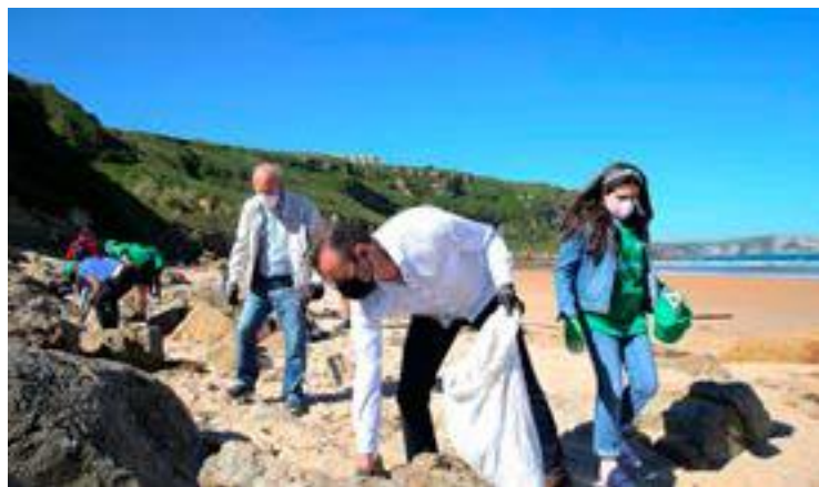
Blanco participa con voluntarios en una jornada de limpieza de playas.

Las actuaciones estarán encaminadas a la conservación y protección de los hábitats naturales, especies de singular interés y preservación del elevado potencial paisajístico de las playas rurales de Cantabria, como parte del patrimonio natural y origen de múltiples servicios ecosistémicos con el objetivo de mejorar y preservar el medio natural y la biodiversidad en equilibrio con su uso y disfrute y de todos sus beneficios por parte de la ciudadanía. Según ha explicado Blanco, las playas rurales que existen en Cantabria representan aproximadamente el 32% de las 91 playas relacionadas con el Plan de Ordenación del Litoral frente al 20% de semirurales, el 22% de perirurbanas y el 26% de urbanas, representando el 45% de las playas