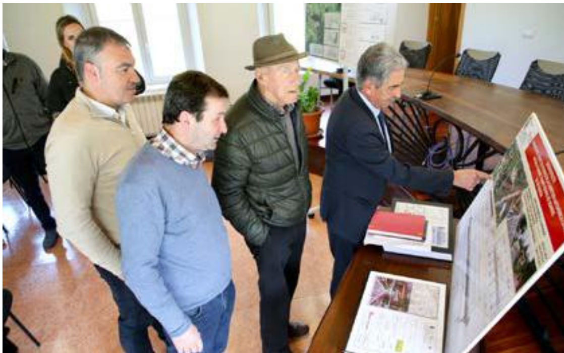
Revilla observa los planos del futuro puente de Ogarrio en presencia de la consejera y el alcalde, entre otros.

Revilla ha destacado el compromiso cumplido con este municipio que en los últimos años ha sido objeto de importantes inversiones para que los vecinos dispongan de buenas comunicaciones viarias y servicios públicos de calidad, en la línea de contribuir a fijar la población en los entornos rurales. Concretamente, ha destacado que estos dos nuevos proyectos son "fundamentales" para Ruesga y responden a una demanda histórica de los vecinos tanto de La Alcomba como de Ogarrio. Sobre la carretera, ha explicado que se trata de la continuación de la primera fase ejecutada en 2020 hasta el núcleo de Barruelo, en la que el Gobierno cántabro invirtió 1,2 millones de euros. "El proyecto completa una carretera de 7 kilómetros que va