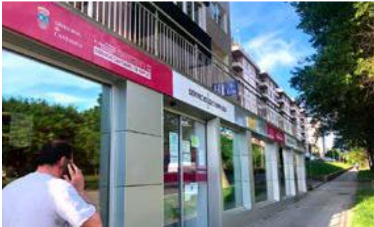
Oficina de Empleo de Santander.