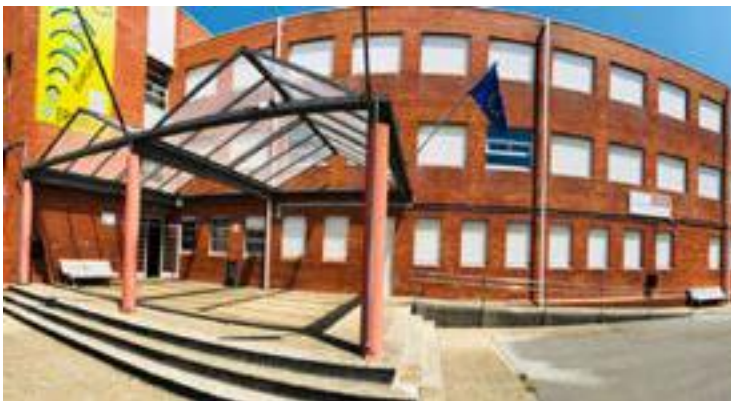
La entrega de premios se hará en el IES Valentín Turienzo.