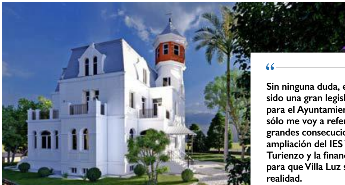
Infografía exterior del edificio Villa Luz.

Javier Incera indicó que el edificio se va a convertir en un centro integral de servicios para las personas mayores, dirigido a trabajar programas de envejecimiento activo y combatir la soledad no deseada. En este edificio se ubicarán los servicios sociales municipales, mientras que todo lo relacionado con el ocio de las personas mayores seguirá