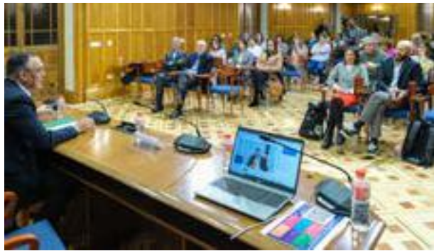
El consejero, durante su intervención en la jornada.