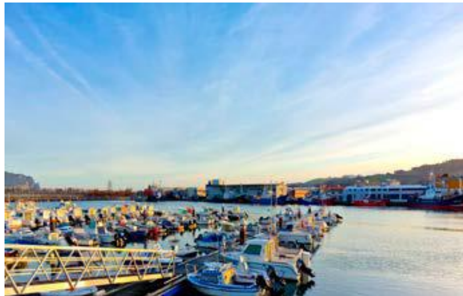
Puerto de Colindres.