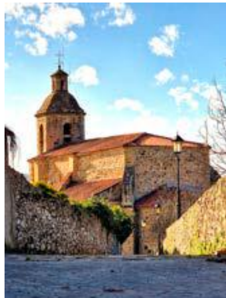
Iglesia de San Juan Bautista.

“ Somos el ayuntamiento de menos de 10.000 habitantes que más inversión anual hace en el mundo del deporte, y también uno de los que cuenta con las mejores infraestructuras deportivas y unos clubes deportivos muy profesionales. Gracias a esto tenemos deportistas de Colindres compitiendo y ganando medallas a nivel nacional e internacional ”