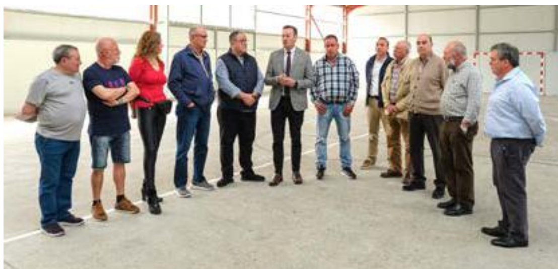
Un momento de la visita a la pista polideportiva de Arredondo.

Tras unas primeras etapas de uso, se constató la necesidad de cubrir la pista, por la ausencia de espacios alternativos ante situaciones meteorológicas adversas, por lo