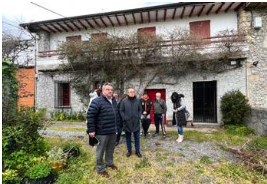
Visita de consejero y el alcalde al edificio que será rehabilitado como albergue para peregrinos.

"Se trata de dos proyectos muy ambiciosos, con una inversión muy alta, y con un objetivo muy claro: hacer de Noja un gran destino turístico con una rica oferta natural,