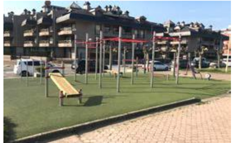
Gimnasio deportivo al aire libre, junto al Parque de los Pescadores.