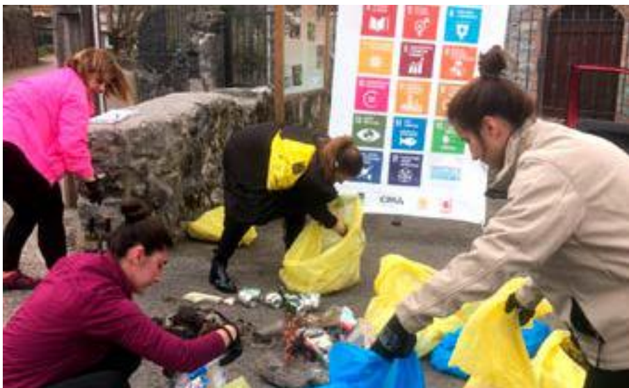
Momento durante la caracterización de residuos.

Información e inscripciones: 942 627 008 - puntosinfo@municipiossostenibles.com