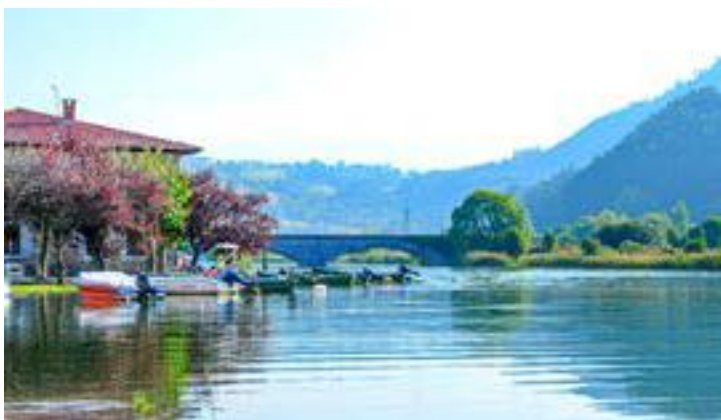
Limpias, mar adentro.

El Icass y el Ayuntamiento de Limpias ultiman un convenio por importe de 935.000 para financiar la rehabilitación de un antiguo edificio en ruinas que se encuentra estratégicamente bien ubicado, cerca del centro de salud, la farmacia, el supermercado, la Casa de la Cultura, el Ayuntamiento, la histórica lonja y el paseo fluvial, lo cual le hace aún más atractivo para este ambicioso proyecto, más arraigado en los países más avanzados de Europa.