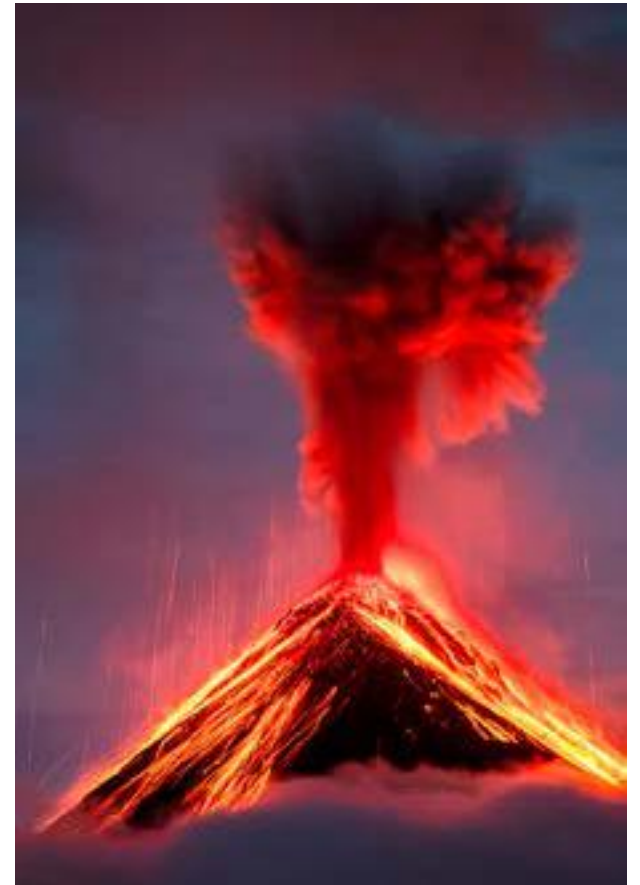
Título: Fuego entre nubes.

FOTONOJA 2023 está dotado con más de 3.000€ en premios y está dividido en 6 categorías temáticas: Fauna general, Mundo de