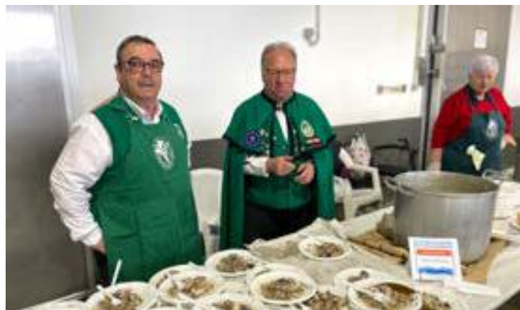
Cofradía del respigo preparó verdel en escabeche.

El sábado 1 de abril, se ha celebrado la IX edición del tradicional Día del Verdel de Laredo. El evento solidario ha dado comienzo a las 12:00 horas, en un ambiente distendido y participativo. Diferentes asociaciones y establecimientos hosteleros pejinos han colaborado en un festejo con degustación popular incluida cuya recaudación será destinada a Cáritas de Laredo. La Cofradía de Pescadores ha donado los verdeles que se utilizarán en el evento y la Peña Los Pejinos los ha preparado asados para el disfrute de los presentes. La asociación Son de Laredo ha servido los platos y atendido a los diferentes comensales que han