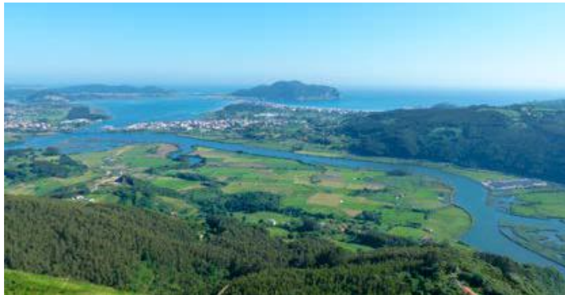
Vista del estuario del Asón, desde el Pico Candiano.

El CV063 alberga una superficie de más de 3.400 hectáreas y forma parte de 9 municipios: Ampuero, Argoños, Bárcena de Cicero, Colindres, Escalante, Limpias, Laredo, Santoña y Voto; que a su vez constituyen el Parque Natural de las Marismas de Santoña, Victoria y Joyel. Dicho espacio, en el que confluyen varias figuras de protección (Parque Natural, ZEC,