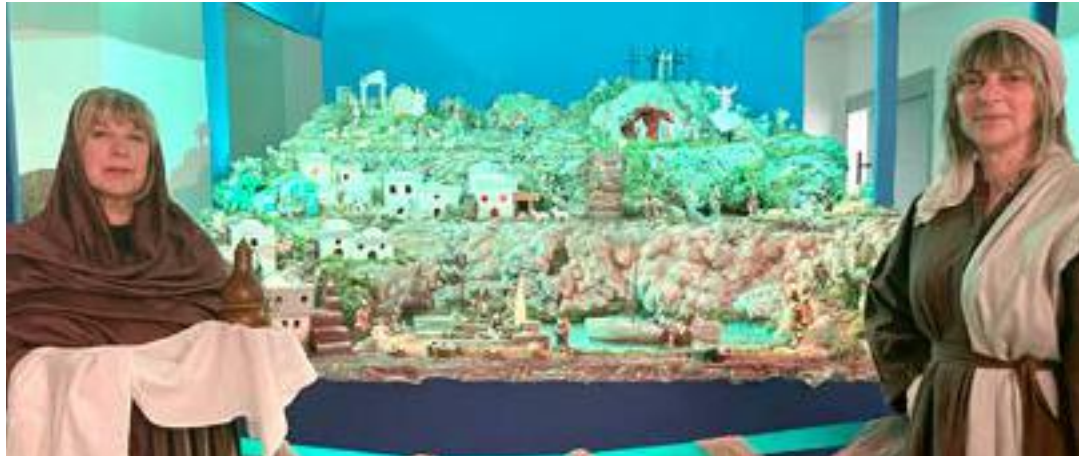
Recreación del Diorama de la Resurrección de Jesucristo.

En el antiguo Ayuntamiento de Laredo ha tenido lugar hoy la inauguración del Diorama de la Resurrección de Jesucristo, que celebra la vuelta a la vida del Señor al tercer día. En la planta baja de la antigua Casa Consistorial se ha presentado la recreación que consta de cinco escenas recogidas en los evangelios de Mateo, Lucas y Juan: la encomienda de los sacerdotes del Sanedrín a Pilato para la custodia del sepulcro; la aparición del ángel a las mujeres, la mañana de la Resurrección; el encuentro de Jesús con los discípulos en la