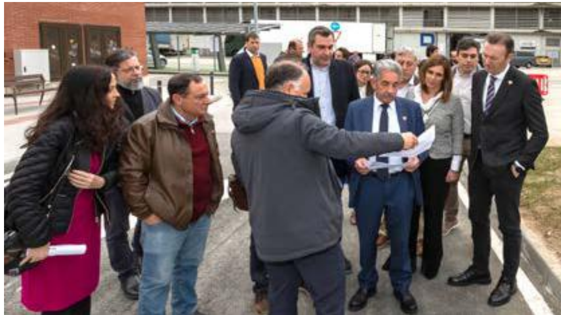
Revilla visita la ejecución de dos obras que aportarán mayor funcionalidad a la instalación portuaria.

El Gobierno de Cantabria, a través de la Consejería de Obras Públicas, Ordenación del Territorio y Urbanismo, está ejecutando una inversión de casi 500.000 euros para mejorar la funcionalidad y la operatividad del puerto de Santoña, a través de dos actuaciones: el acondicionamiento de los pantalanos de la dársena deportiva, con un presupuesto de 445.000 euros, y la construcción de un nuevo vial secundario de salida de los vehículos pesados hacia la CA-241 (Cicero-Santoña), que supone un coste cercano a los 46.000 euros. Más allá de la inversión movilizada, el jefe del Ejecutivo ha destacado la utilidad de estas dos obras que, por un lado, soluciona los problemas de degradación de los pantalanos y mejora las instalaciones de la