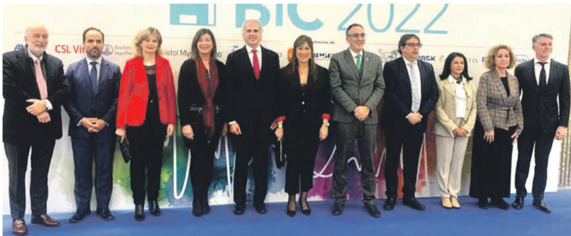
El consejero y parte de la delegación de Valdecilla, momentos antes de la entrega de los premios BIC 2022.