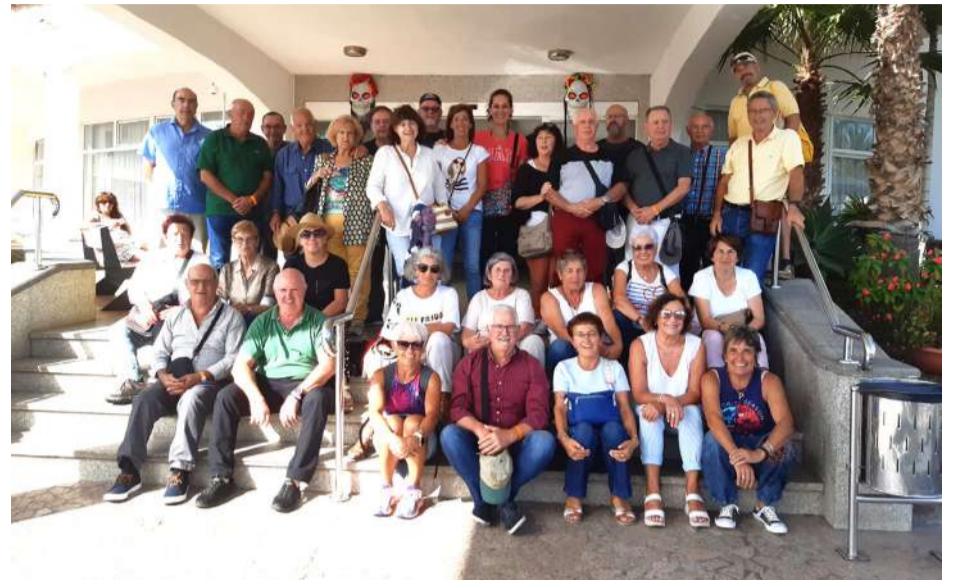
Participantes junto al Teniente Alcalde Jesús Ramón Abascal.