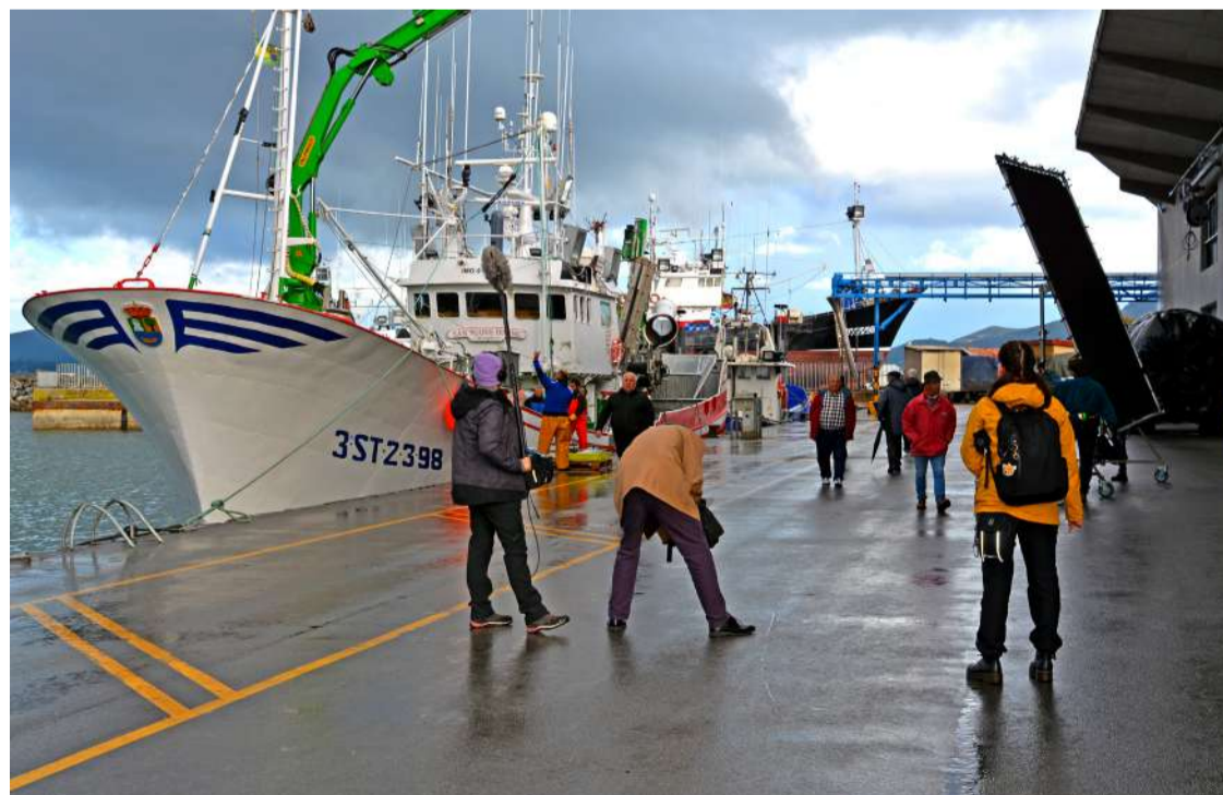
Momento de la grabación del cortometraje.

El cortometraje se ha filmado en Santander, Liencres, Voto,