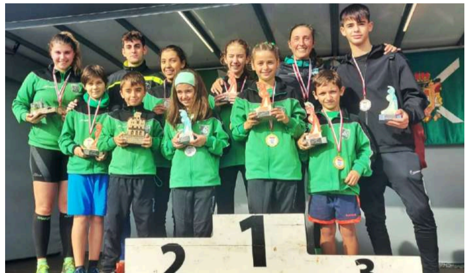
Atletas castreños en el Pódium.

En general una gran participación de los Carboneros en una prueba como es la marcha que requiere una técnica muy existente.