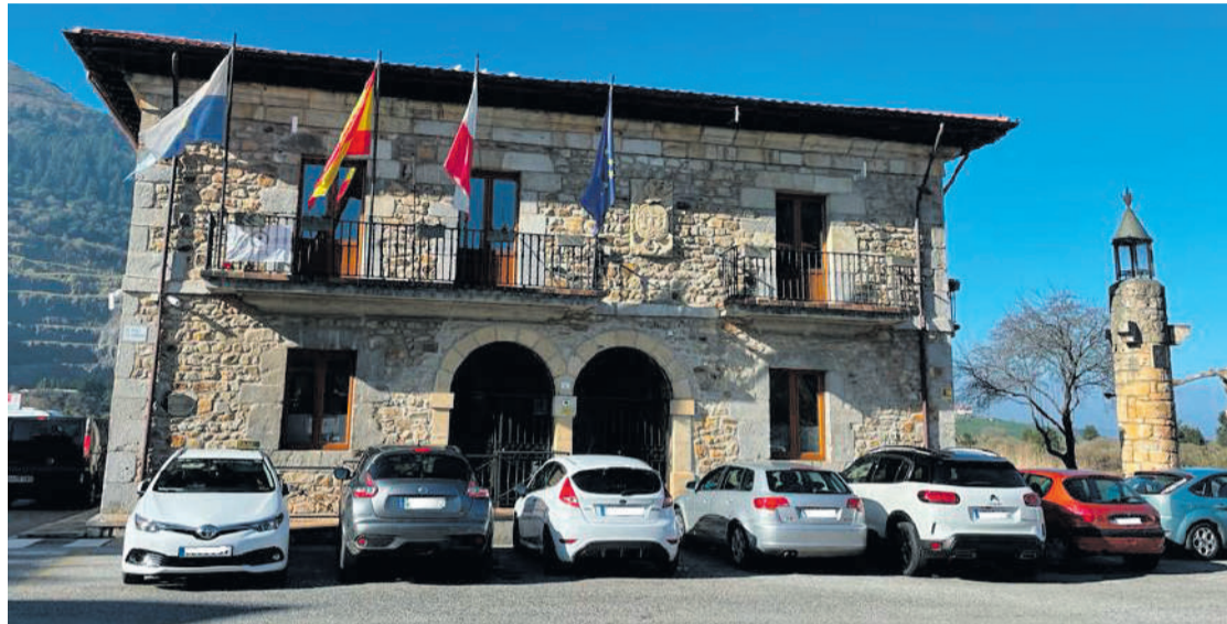
Ayuntamiento de Limpias.

Se han concedido 225.000 euros para la construcción de una guardería infantil para alumnos de 0 a 2 años, que se construirá en la antigua panadería. La antigua Lonja cuenta con un presupuesto de 1,2 millones de € que se destinarán a