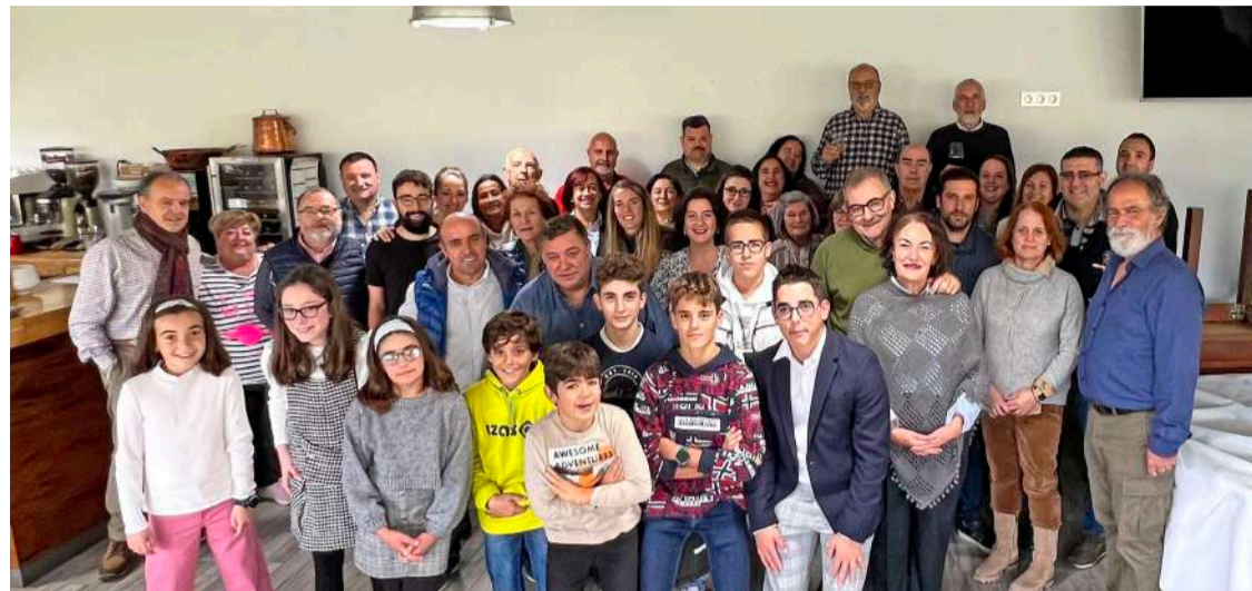
Foto de familia del Club Piragüismo de Limpias.

El club de piragüismo de Limpias cuenta actualmente con 69 fichas de deportistas, 4 técnicos y 2 árbitros, existiendo una apuesta decidida por el deporte de base, con 21 fichas entre las categorías que van desde prebenjamín hasta juvenil, estando el enfoque del club dirigido a