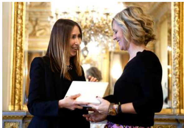
Palacio recoge el galardón del Concurso de Cementerios de España.

El de Ballena de Castro-Urdiales, ha sido galardonado en la categoría de “Mejor Actividad