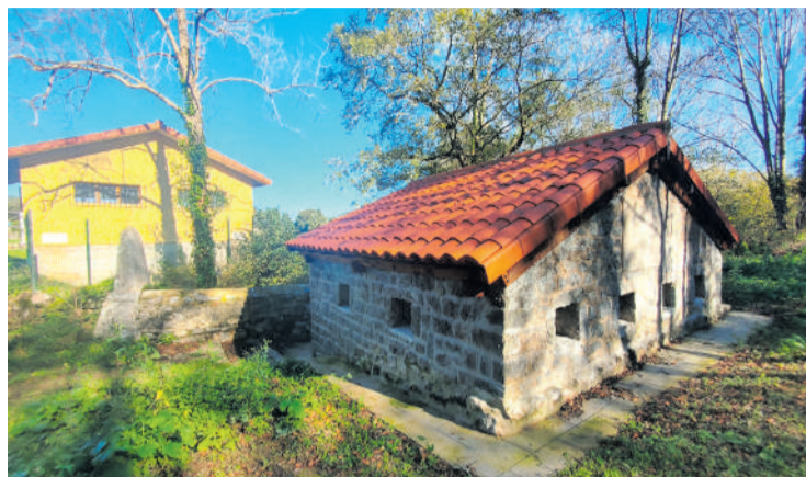
Lavadero y caseta de bombas de de las Torcas remodelados.

El Ayuntamiento de Hazas de Cesto ha finalizado las obras de reparación del lavadero y la caseta de bombas de Las Torcas en la localidad de Hazas de Cesto. La actuación ha supuesto una inversión de 36.000 euros y que han consistido en la sustitución íntegra de ambos tejados así como las viguetas de madera de la construcción. La actuación se ha completado con la reparación de las fachadas. El equipo de Gobierno municipal ha agradecido la gestión de la Junta Vecinal de Hazas de Cesto, preocupada en todo momento por mantener y recuperar espacios que forman parte del patrimonio cultural del municipio y que cuentan por tanto con un gran valor sociológico y etnográfico, como es el caso de los lavaderos públicos distribuidos por muchos pueblos de la geografía cántabra y que se caracterizaban antiguamente, además de para desempeñar las labores de lavado cotidianas, como puntos de