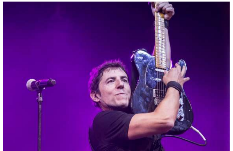
Manel Fuentes & The Spring's Team rinden tributo en Noja a Bruce Springsteen en el último evento musical antes de la programación navideña