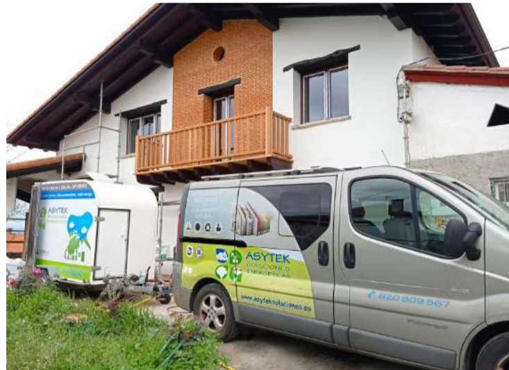
Asytek Soluciones Energéticas, la solución profesional para aumentar la eficiencia energética en tu hogar.

y pueden marcar la diferencia entre la eficiencia y el derroche. Acometer un aislamiento completo, con techos y paredes incluidos, puede suponer ahorros energéticos de hasta un 46%. Una empresa de Laredo, Asytek Soluciones Energéticas , ha encontrado un modo eficaz de realizar este tipo de trabajo, aplicando un material muy presente en bioconstrucción y construcción sostenible desde hace décadas, la guata de celulosa (AISLANAT), que actúa como aislamiento térmico y acústico. Este material está compuesto por papel de periódico triturado y sal de boro, permite la transpiración y regula la humedad. Se trata de un aislante