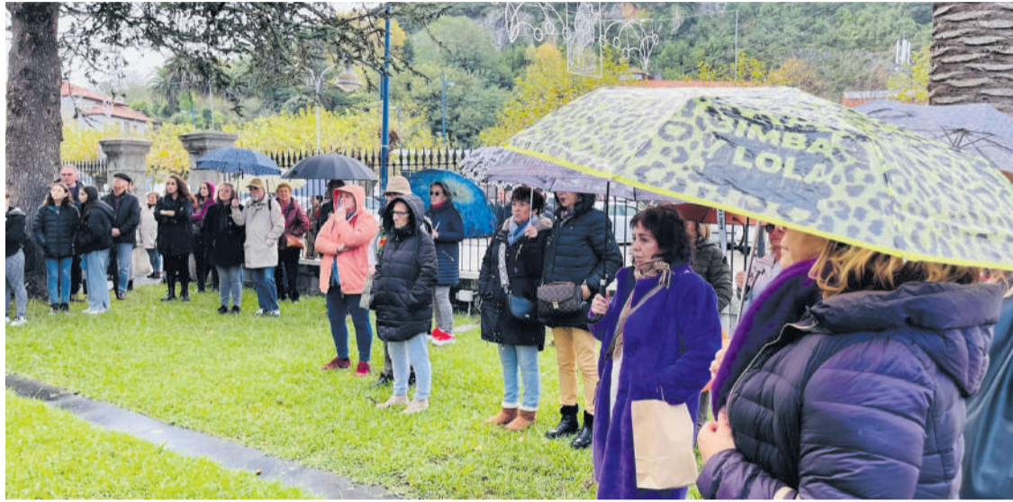
Momento de la concentración en Laredo.