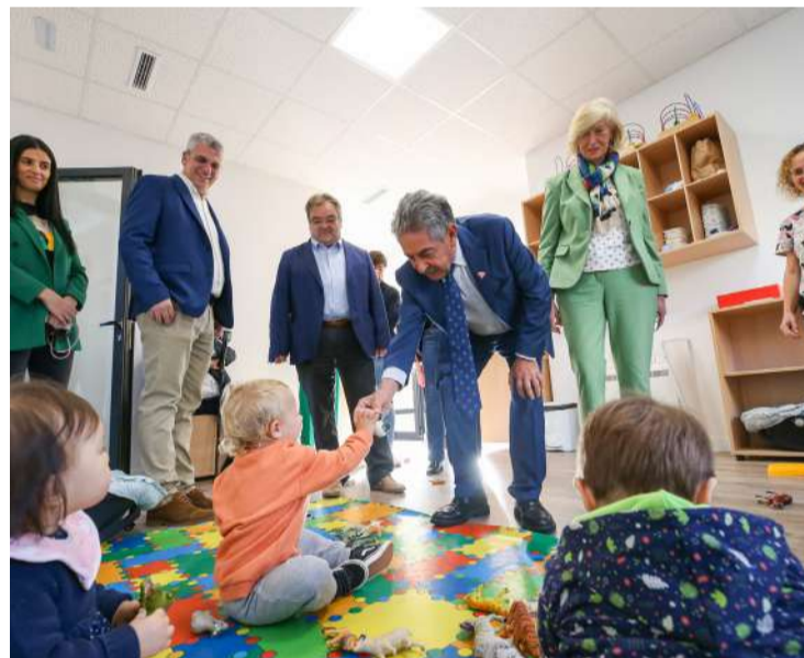
El presidente, junto con la consejera y el alcalde, en un momento de la visita al centro.