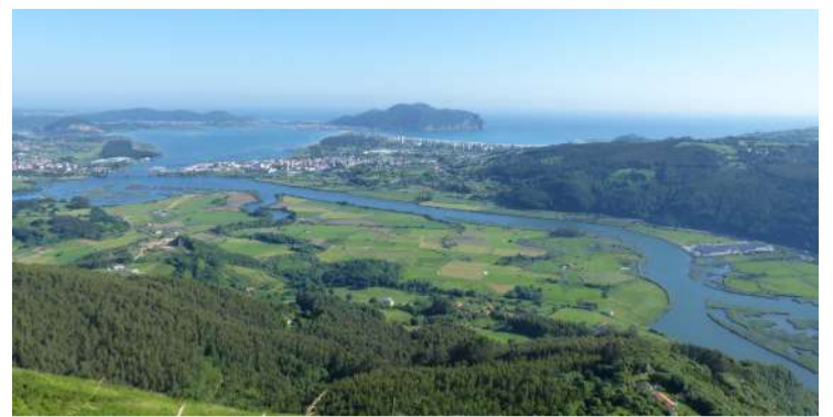
Panorámica de las Marismas.