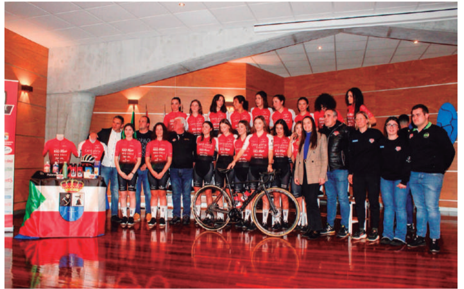
Presentación de todos los equipos del Club Ciclista Meruelo.