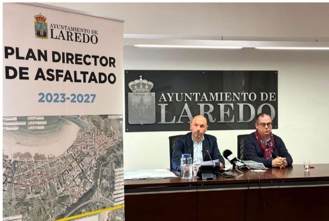
Momento de la presentación del Plan Director de Asfaltado para la renovación de viales en todo el casco urbano.

Concretamente, en la primera, los trabajos se realizarán en una superficie de 56.680 metros cuadrados con una inversión de 2.391.970 euros. En la segunda, la rehabilitación se llevará a cabo en una superficie de 95.000 metros cuadrados con una