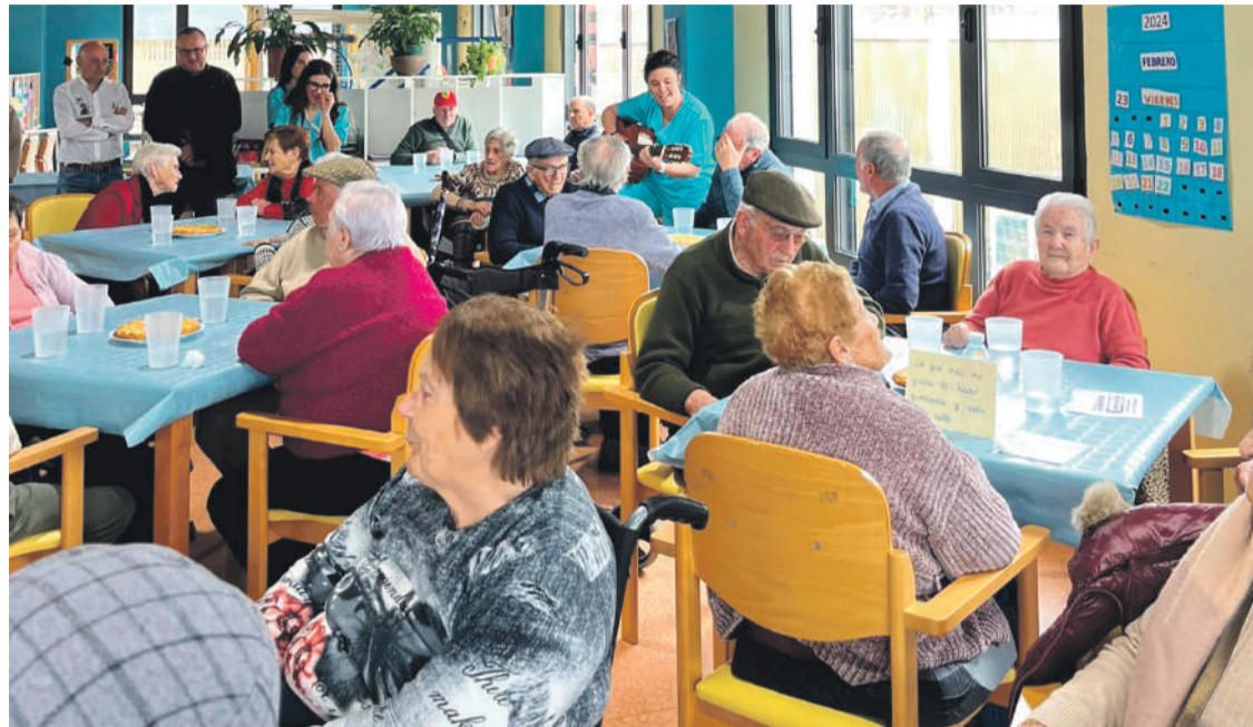
El Centro de Día de Colindres celebró su quinto Aniversario con una jornada para los mayores.

Los actos de celebración del quinto aniversario de la puesta en marcha del Centro de Día consistieron en una jornada de convivencia donde los usuarios participaron contando sus actividades diarias y como se encuentran en el centro a los invitados a la celebración,