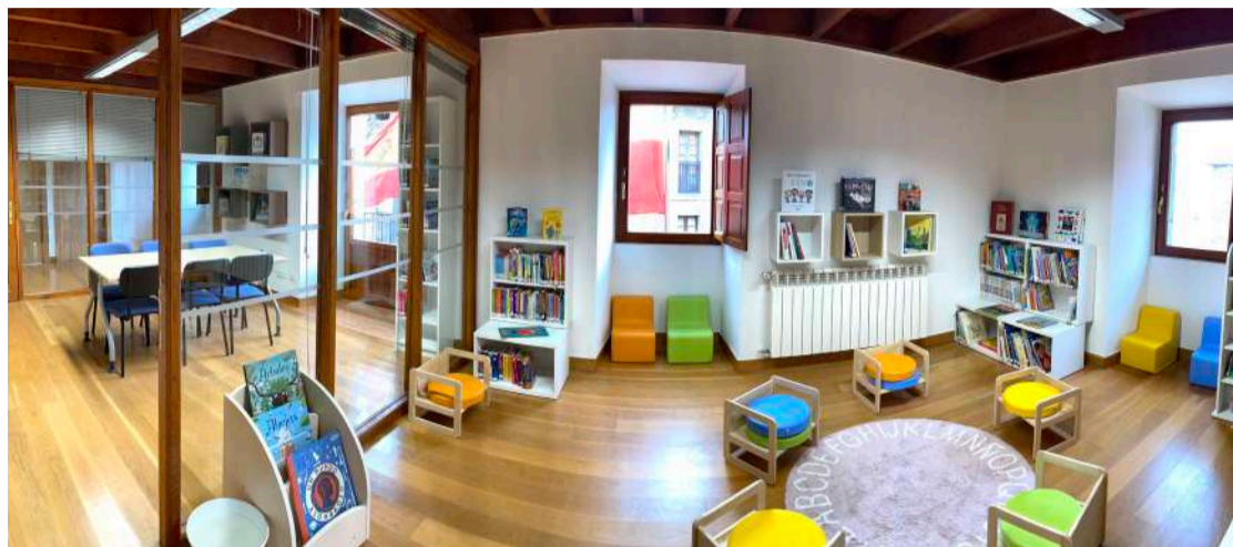
Las nuevas salas infantil y juvenil de la Biblioteca de Limpías.

La intervención global en la Casa de Cultura ha permitido una optimización de los espacios, dando lugar a un área de Biblioteca infantil y juvenil