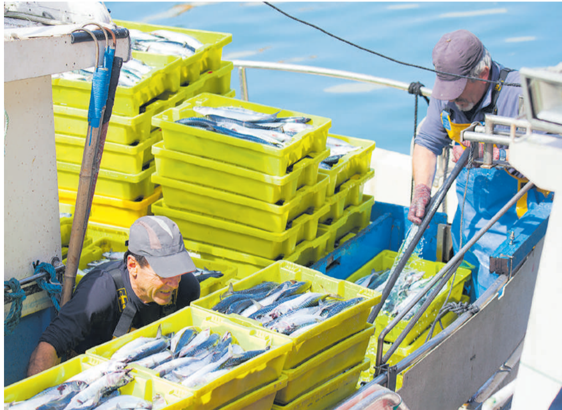
Puerto de Santoña.

Así, se consideran como gastos subvencionables la modernización o acondicionamiento de bienes inmuebles; la adquisición de maquinaria, instalaciones y equipos