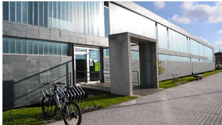
Centro de Ocio Playa Dorada en Noja.

La actuación, con un coste de 40.000 euros, incluirá la instalación de un pavimento antideslizante, dos porterías de balonmano y cuatro canastas