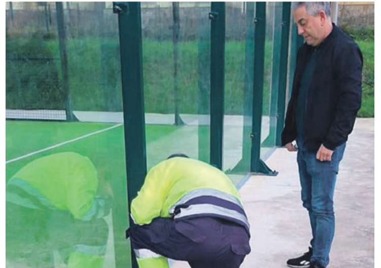
Visita del Alcalde al colegio para comprobar las mejoras realizadas.