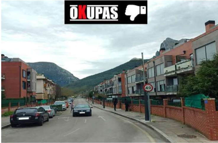
Urbanización Cuatro Caños en Ramales de la Victoria.