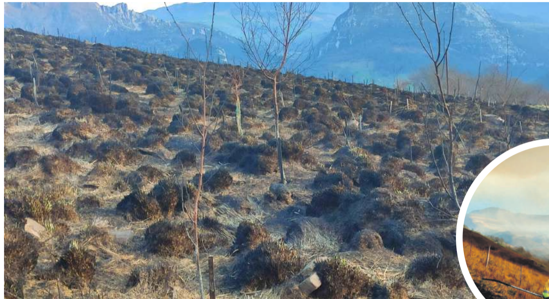
Incendio en la Sierra de Ramales de la Victoria.

Desde el año 2019, esta asociación, referente en la conservación de la naturaleza de Cantabria, ha venido realizando diversas actuaciones de reforestación en terrenos de la zona que ahora ha sido arrasada, enmarcadas todas ellas en dos de los proyectos más representativos que desarrolla esta Asociación con el patrocinio del CIMA (Centro de investigación del Medio Ambiente) del Gobierno de Cantabria. Para el desarrollo de uno de ellos, el denominado "REFORESTA bosques frente al cambio climático" que pretende crear nuevos bosques