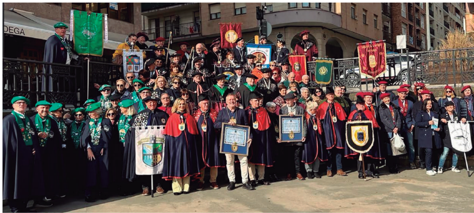
Celebración del Capítulo de la Cofradía de la Morcilla de Beasaín, a la que acudieron diferentes cofradías cántabras, entre ellas la cofradía de la Nécora de Noja.

Como ya se sabe, este tipo de asociaciones gastronómicas sin