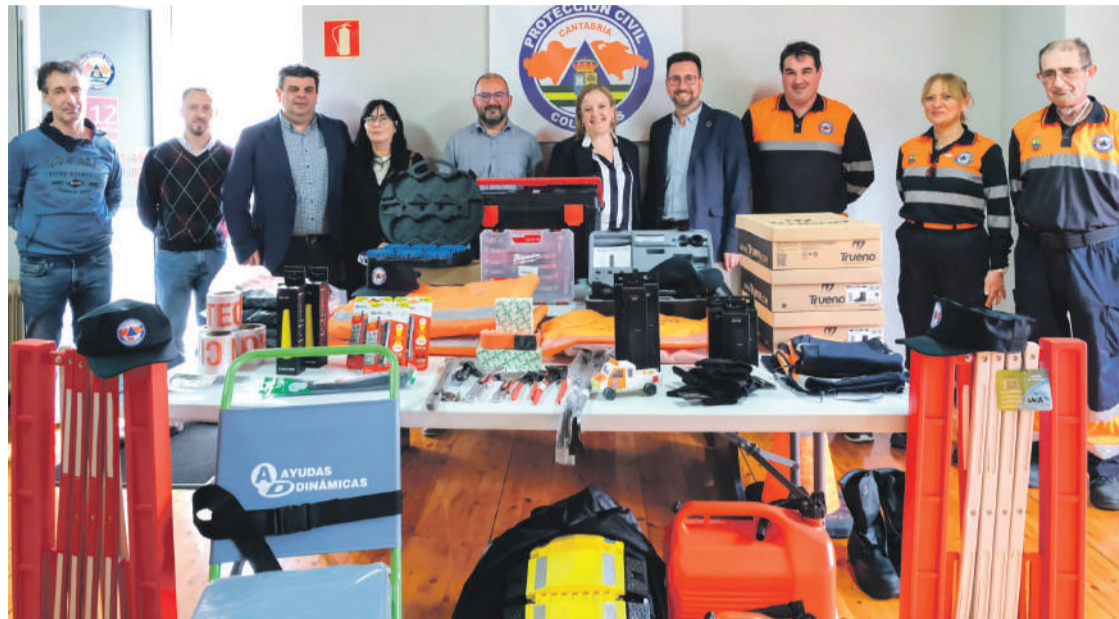
Acto de entrega del nuevo equipamiento a la Agrupación Municipal de Voluntarios de Protección Civil de Colindres.

1996, es según la Consejera de Seguridad, todo un referente de la Costa Oriental de Cantabria, ya que no son solamente una garantía para que los actos salgan bien, sino que además apoyan