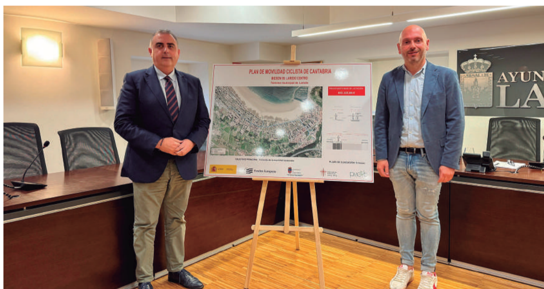
Miguel González y Media presentan el proyecto de carril bici “Laredo centro”.

Acompañado del alcalde de Laredo, Miguel González, el consejero ha explicado que este carril bici, que forma parte del Plan de Movilidad Ciclista de Cantabria, tendrá 2,7 kilómetros de longitud, una anchura de 2,20 metros más una banda de separación de medio