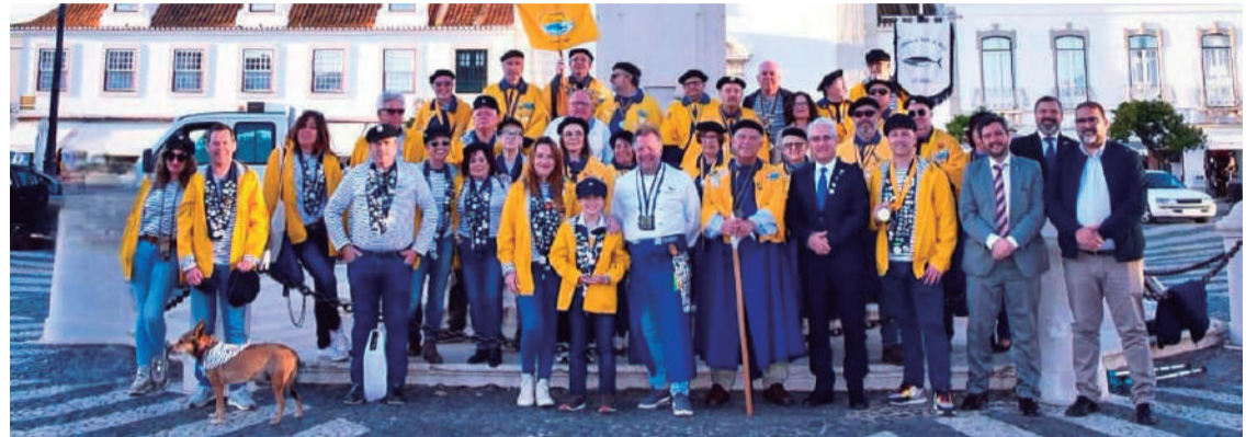
Componentes de ambas cofradías en la localidad de Villa Real de Santo Antonio.