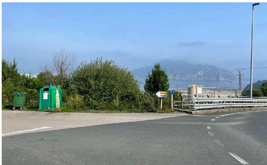
La carretera comienza en el Alto de Laredo, junto al puente sobre la autovía A-8.

La Consejería de Fomento, Ordenación del Territorio y Medio Ambiente ha adjudicado el proyecto de mejora de la carretera CA-500, entre el Alto de Laredo y Seña, que tendrá un presupuesto de 2,3 millones de euros y un plazo de ejecución de 18 meses, lo que permite resolver uno de los grandes temas pendientes en infraestructuras de nuestro municipio. La actuación permitirá incrementar la anchura de la plataforma hasta los 5,5 metros, más sobrecanchos en curva, y mejorar la seguridad vial en un tramo de casi 3 kilómetros de longitud (2.950 metros), desde el comienzo de la carretera en el Alto de Laredo, junto al puente que supera la A-8, hasta el