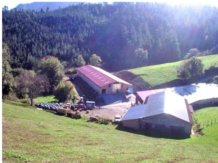
Proyecto rural desarrollado por Grupo Matienzo.

Tenemos un profundo conocimiento y respeto por las necesidades y retos únicos que presenta la vida rural, y brindamos una variedad de servicios diseñados para fomentar el crecimiento, la