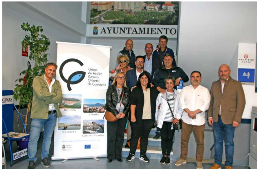
Junta directiva del Grupo de Acción Costera Oriental.

El pasado 25 de junio ha abierto nuevas convocatorias de ayudas europeas en Cantabria Oriental para que promotores puedan presentar solicitudes de ayuda a proyectos de inversión en Economía Azul que contribuyan a la dinamización y desarrollo