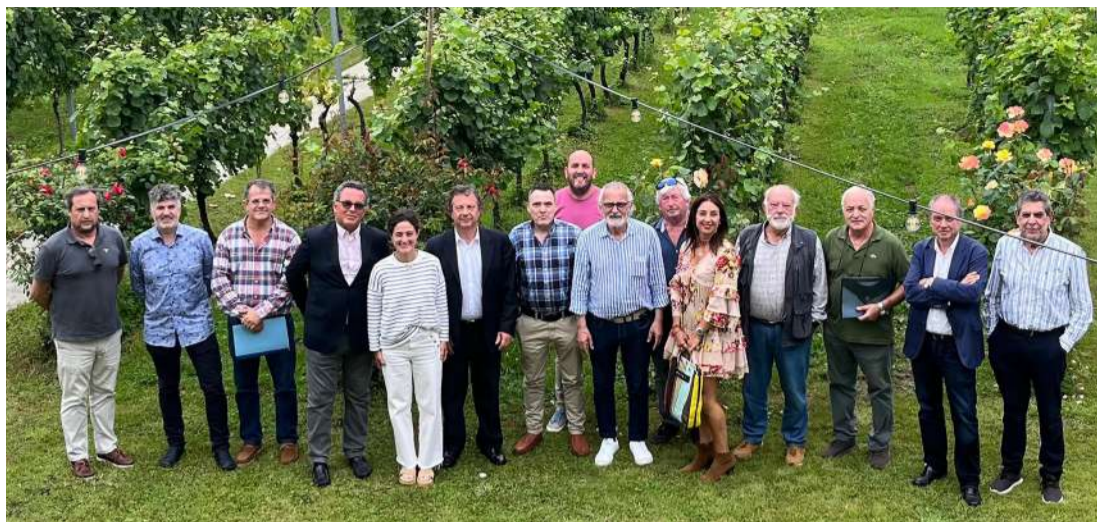
La Mesa del Vino posa en Bodegas Hortanza, en Guriezo.