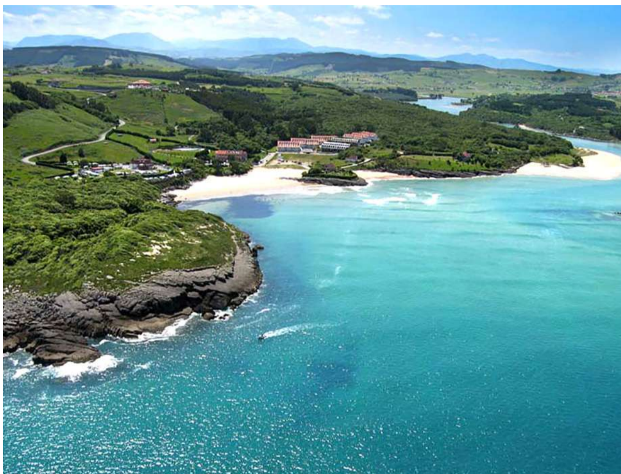
Playa de la Arena, Isla.