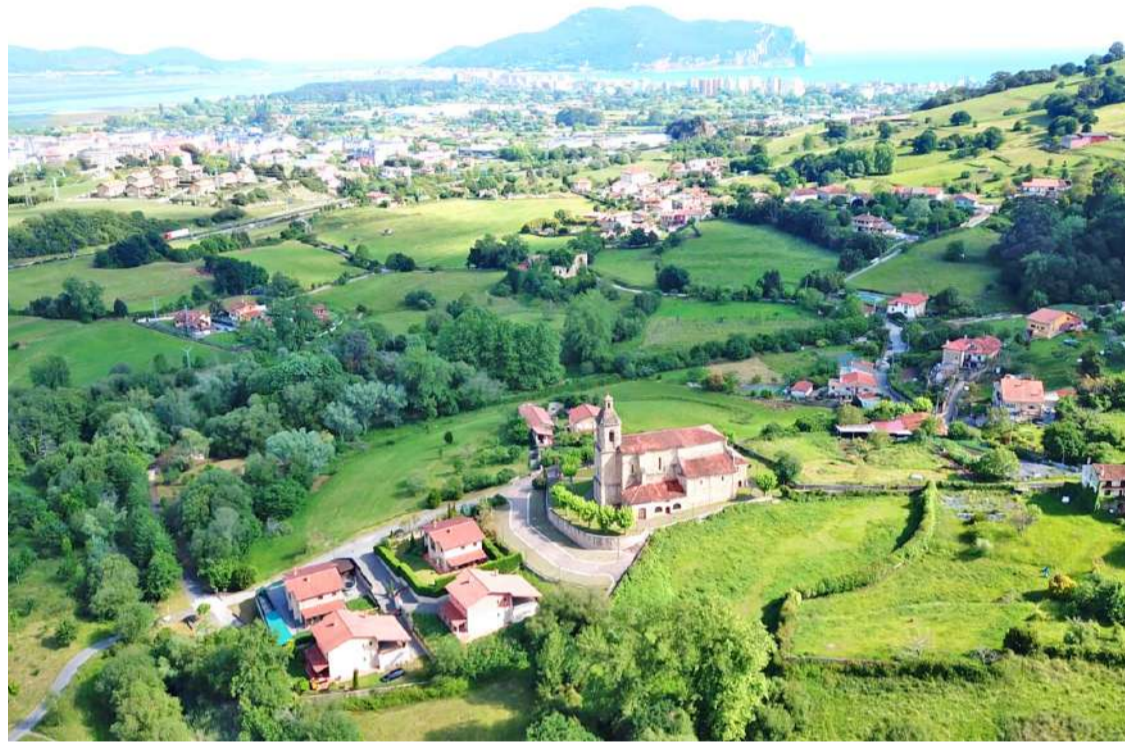
Vista aérea de Colindres de Arriba.

“ Estos trabajos no sólo servirán para mejorar el aspecto del casco antiguo del municipio, sino que mejoran los servicios para los vecinos y vecinas de Colindres de Arriba