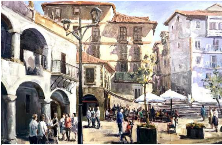
Obra de Jokin Tellería, ganador del XIV Certamen de Pintura al aire libre Puebla Vieja 2024.