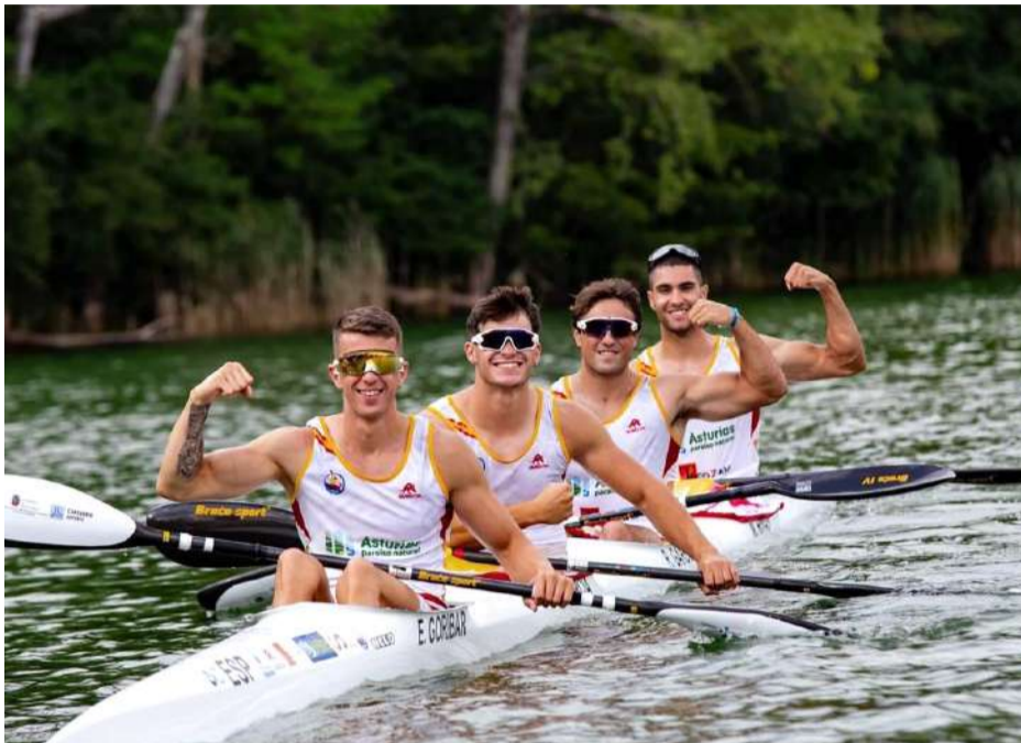
Campeonato de España Sprint Olímpico celebrado en Avilés.