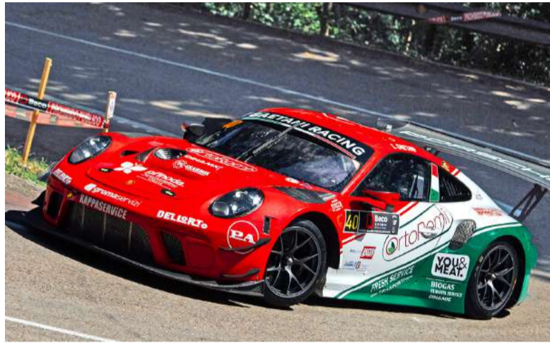
Subida a la Bien Aparecida en 2024.