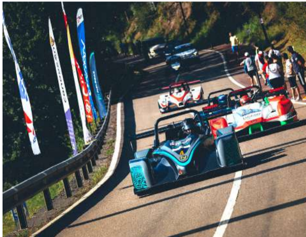
Subida a la Bien Aparecida en 2024.