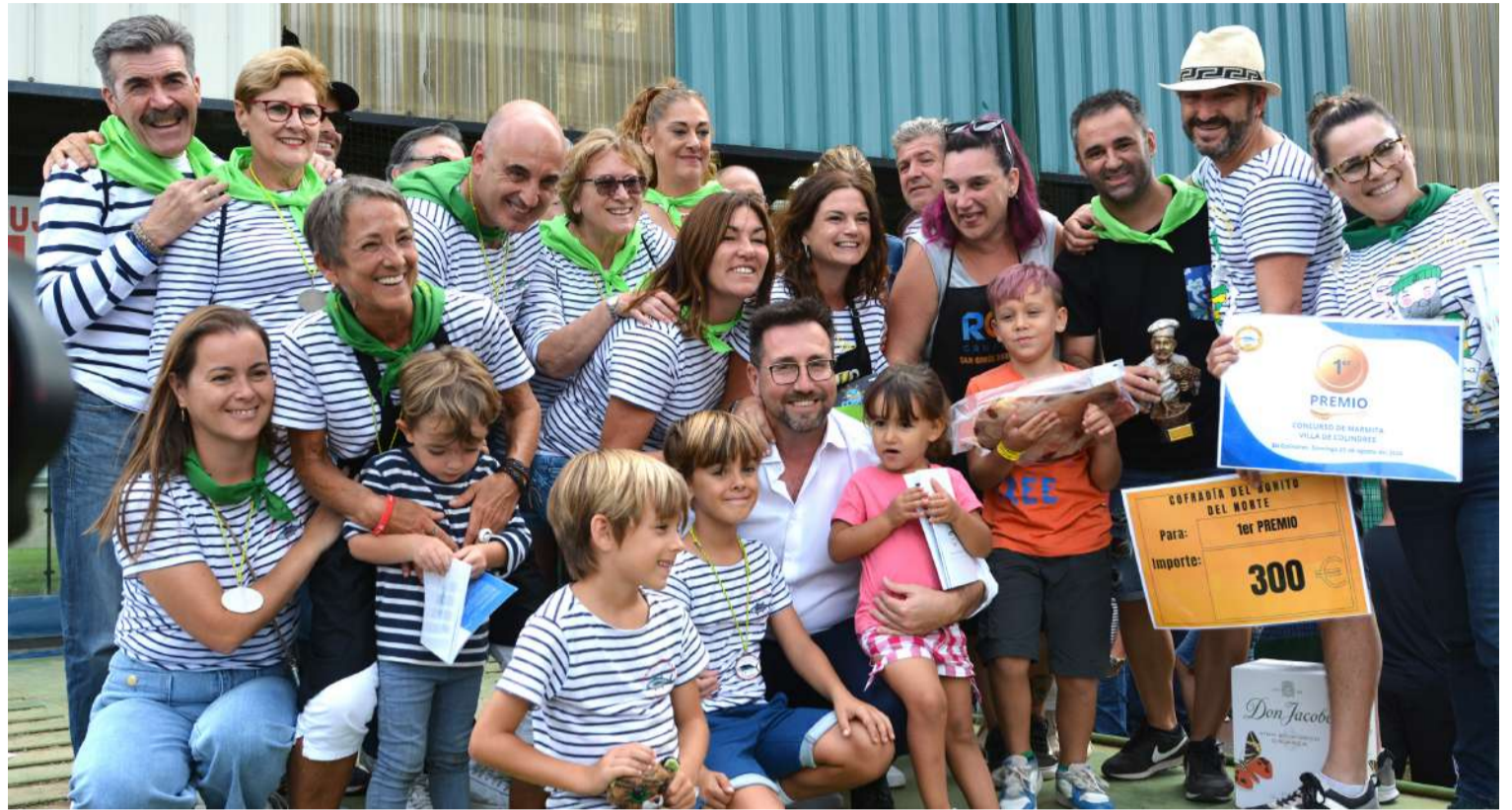
Momento de la entrega de premios del Concurso de Marmita de Bonito Villa de Colindres.

Las cuadrillas comenzaron a elaborar sus guisos y a partir de las 14:00 horas se empezaron a presentar los platos al jurado que este año estaba compuesto por varias cofradías gastronómicas de Cantabria como la de La Anchoa, la del Respigo, La Nécora, El Hojaldre, El Orujo y El Vino de Liébana, El Tomate y El Pimiento de Ampuero, Los Cocidos de Torrelavega y el Queso de Cantabria. También participaron en el jurado el reputado gastrónomo asturiano Carlos Guardado, miembros