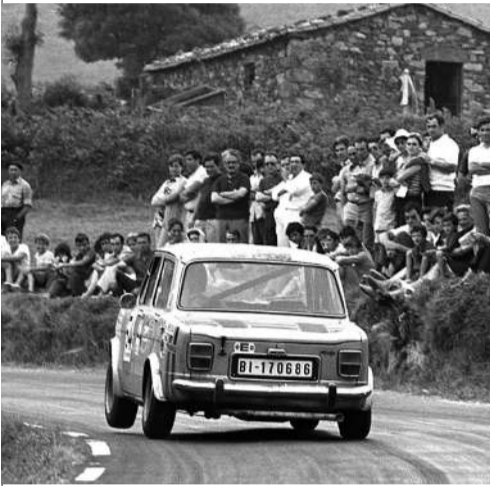
Subida a la Bien Aparecida en 1972.