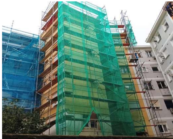
Rehabilitación de Edificio en Cuesta de la Atalaya, Santander.

En cualquiera de los casos, tras la valoración inicial será imprescindible realizar un proyecto técnico y obtener la licencia municipal de obras correspondiente.