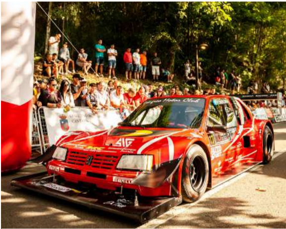
José Antonio Lopez Fombona, campeón de España de montaña (2024)