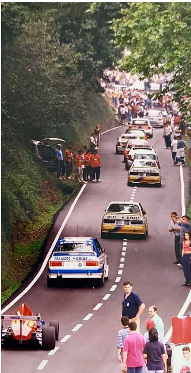
Subida a la Bien Aparecida en 1997.