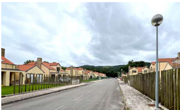
Farolas del barrio La Revilla en Hazas de Cesto.