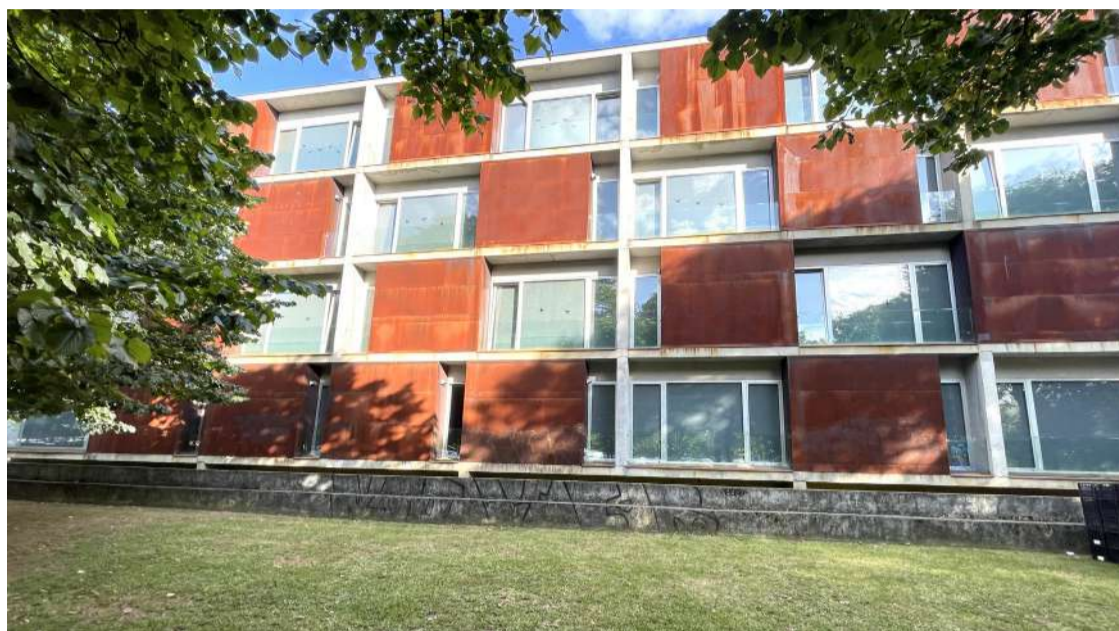
Escuela Oficial de Idiomas de Laredo.

En la sede de Laredo se imparten clases de inglés, francés y alemán presencial e inglés semipresencial y a distancia (That's English); en Castro Urdiales, inglés y francés