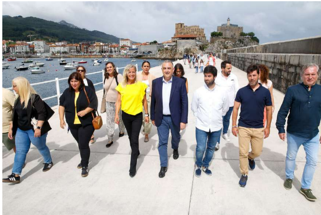
El consejero, la alcaldesa y el resto de autoridades presentes recorren el rompeolas tras el acto inaugural.

También ha valorado el compromiso cumplido con los plazos de la obra -"ni un solo día de retraso"- y ha anunciado la reciente aprobación de un proyecto menor de 48.000 euros para mejorar el acabado de toda la