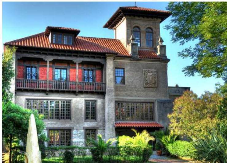
Palacio de Albaicín, en Noja.

El Consistorio está a la espera de que Patrimonio dé el visto bueno al proyecto, que prevé instalar un ascensor y recuperar la torre