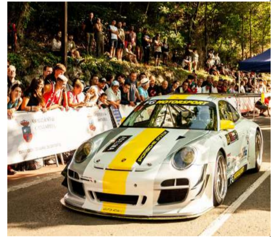
Gustavo Castro, piloto cántabro sexto clasificado en turismos (2024).