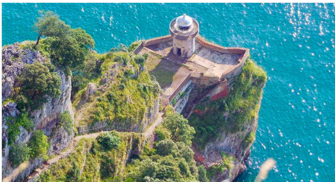
Una plataforma de reservas gratuitas ya está activa en la página web del Ayuntamiento de Santoña.