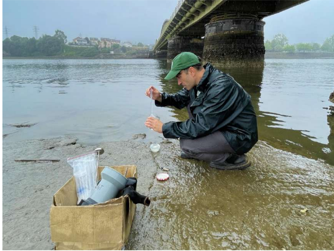
Realización del segundo de los muestreos en uno de los puntos seleccionados.

Dicho proyecto es promovido por la Mancomunidad en el marco del proyecto LIBERA, creado por la ONG SEO/BirdLife en alianza con Ecoembes, y con la colaboración del Gobierno de Cantabria a través del Centro de Investigación del Medio Ambiente (CIMA) y de la Fundación Hombre y Territorio (HyT). El objetivo del proyecto es caracterizar y cuantificar la contaminación difusa causada por la presencia de microplásticos en aguas superficiales, así como identificar las principales fuentes que condicionan su distribución y abundancia en el Parque Natural de