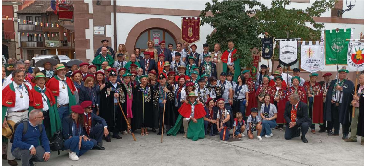
Celebración del II Capítulo de la Cofradía del Tomate y Pimiento de Ampuero.

Con motivo de esta primera celebración, aprovecharon para tomar juramento todos los miembros de la Cofradía del Tomate y Pimiento de Ampuero, ejerciendo para ello como Padrinos La Cofradía del Bonito del Norte