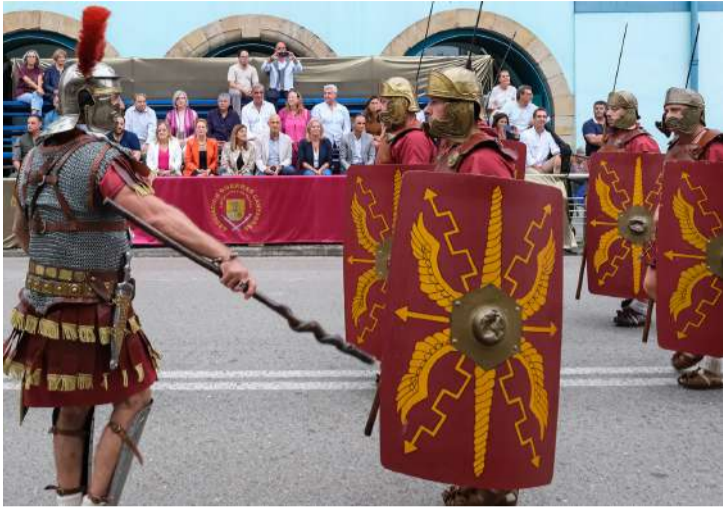
Desfile de tribus cántabras y legiones romanas.