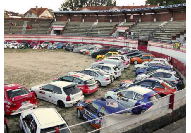
Concentración en la Plaza de Toros de Ampuero.