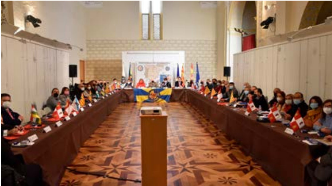
Participantes en la Asamblea General, en Calatayud.

El Ayuntamiento de Noja ha participado durante el pasado fin de semana en la primera Asamblea General presencial que ha celebrado la Asociación Española de Fiestas y Recreaciones Históricas, de la que forma parte desde 2018 con la celebración del Privilegio de Vara.