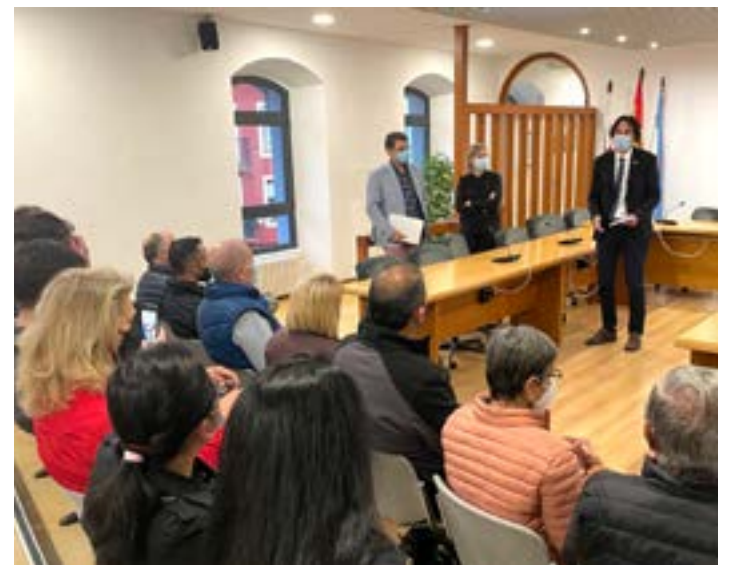
El alcalde, en la reunión con los inversores del sector.