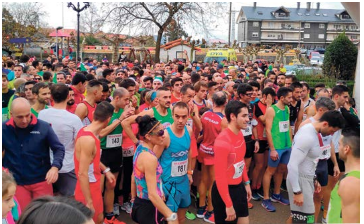
Salida de la carrera XII San Silvestre de Gama, 2019.