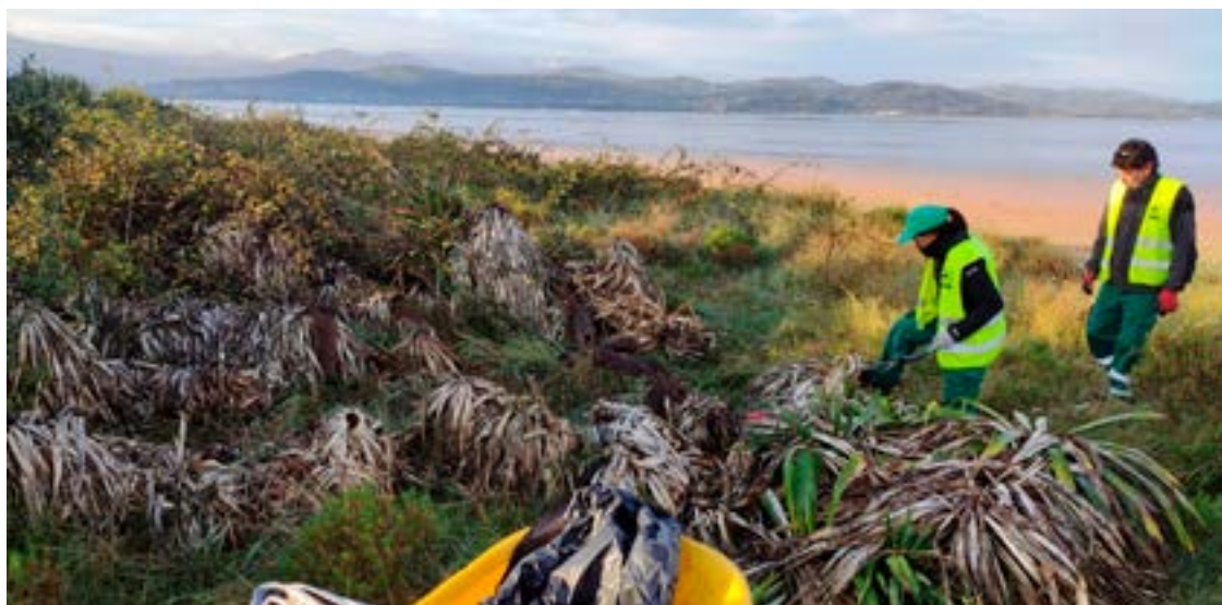
Eliminación de Yuca, una especie exótica invasora.