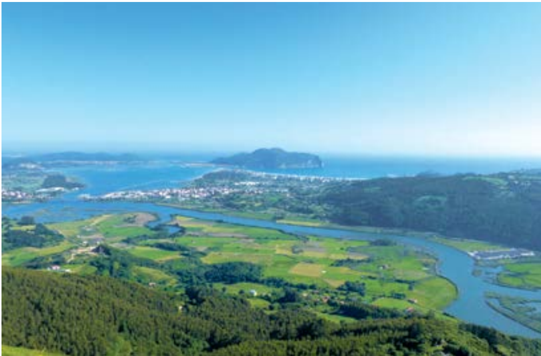
Estuario del Asón.

Con el objetivo de impulsar la formación, la institución académica UNED (Universidad Nacional de Educación a Distancia), como año consecutivo realizará en la sede de Colindres, concretamente en el antiguo Colegio Los Puentes, la impartición de cursos de formación, bajo el slogan “Nuestro entorno, nuestro futuro”. El ayuntamiento de Colindres, con la alcaldía de Javier Incera, permitió en 2018 que