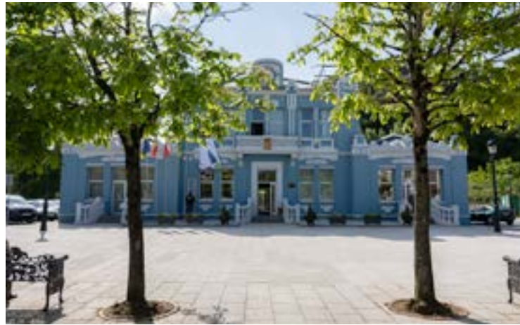
Ayuntamiento de Colindres.

Los colindreses que no hayan recibido sus bonos por no encontrarse en sus domicilios en el momento del reparto de los mismos, pueden retirarlos en las oficinas de Alianza (calle José María Alonso Blanco 8), entre el martes 2 y el viernes 5 de la próxima semana, en horario de 10.00 a 12.30 horas