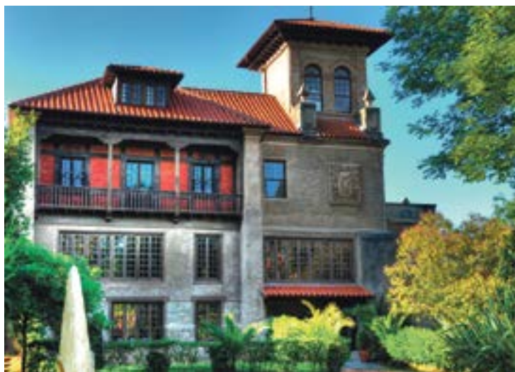
Palacio de Albaicín de Noja.

Dirigido a todas las edades, tiene lugar los martes y miércoles de 18:00 a 20:00 horas. Para los mayores de 18 años se pone en marcha la casa lector 'Entre líneas', un espacio para que las personas