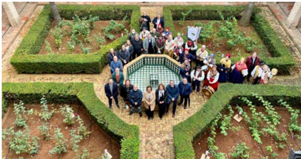
Autoridades locales, entre otros, en el Palacio de los Marqueses de la Algaba.

Tras un recorrido a pie hasta el Palacio de los Marqueses de la Algaba al son de la música regional interpretada por la