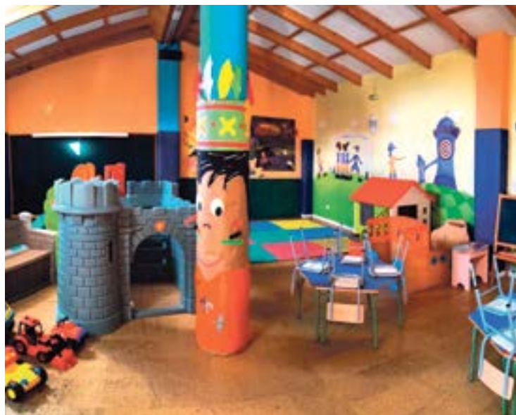
Instalaciones de la ludoteca municipal de Colindres.

Varias de las actividades estarán orientadas a los niños y niñas más