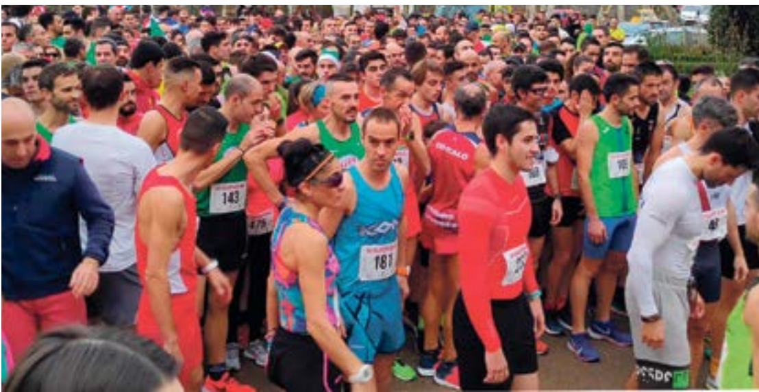
Salida de la carrera XII San Silvestre de Gama, 2019.