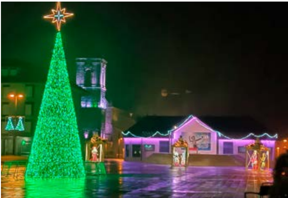
Luces de Navidad en la plaza del Ayuntamiento el año pasado.